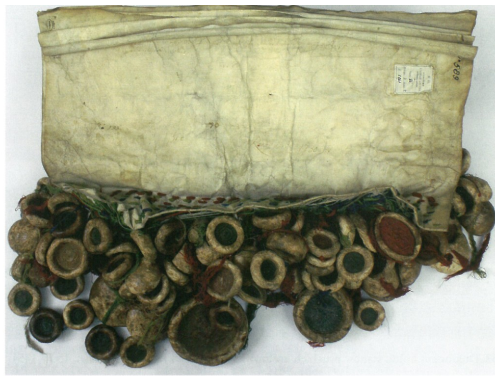
51. Dokument traktatu w Brześciu Kujawskim, 31 XII 1435 – pieczęcie