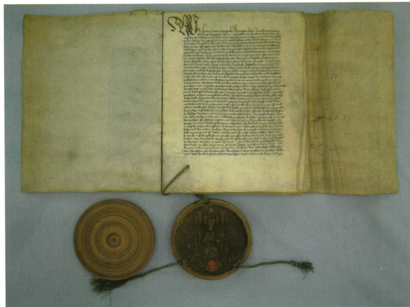
54. Wyrok cesarza Fryderyka III z 1453 r.