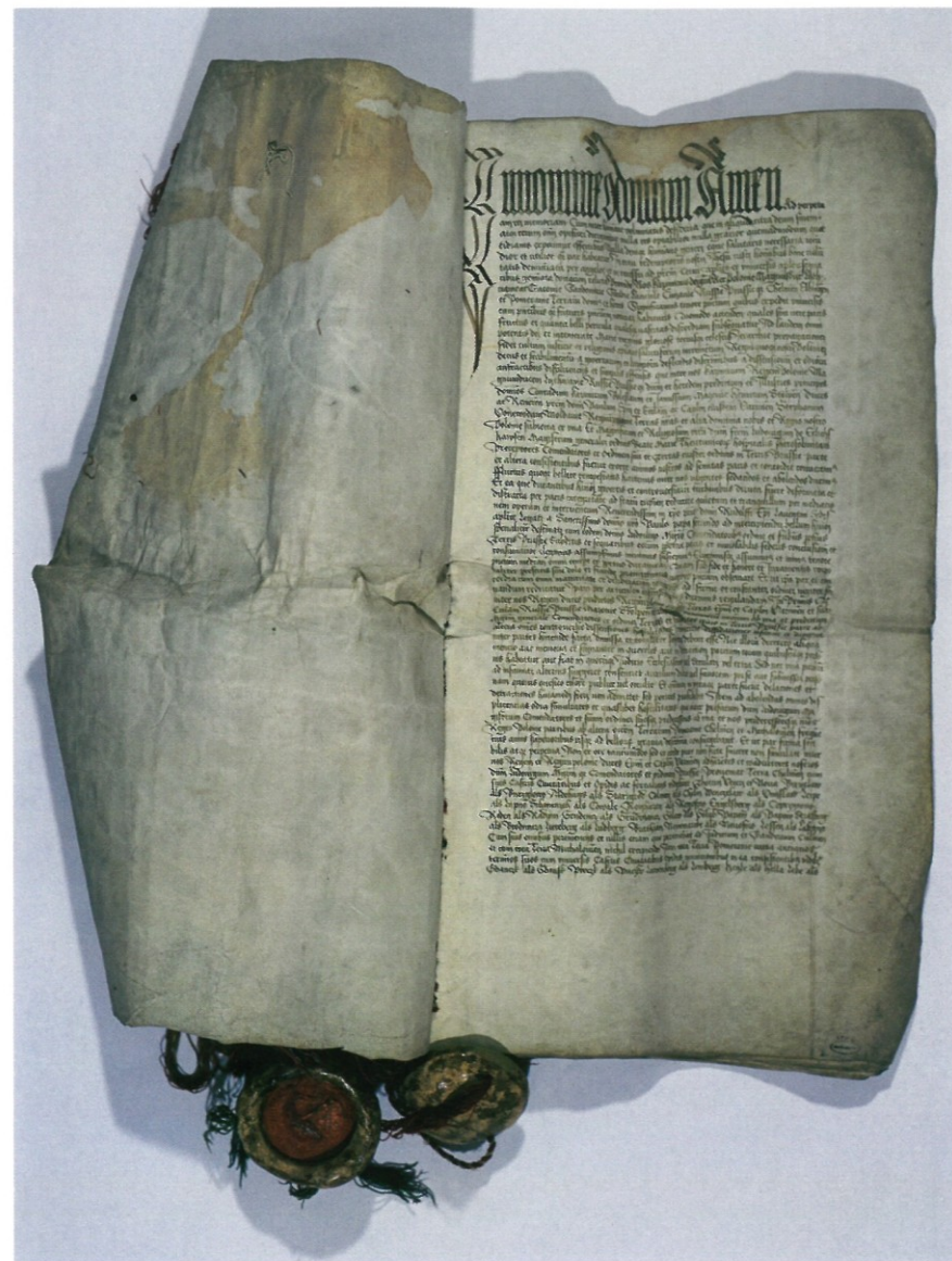
55. Dokument traktatu toruńskiego, 19 X 1466 – pierwsza strona