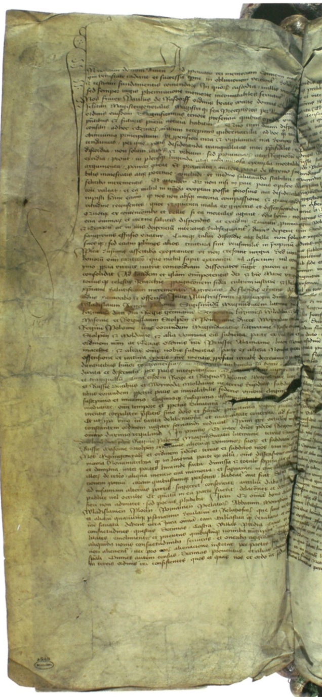
50. Dokument traktatu w Brześciu Kujawskim, 31 XII 1435 – pierwsza strona tekstu