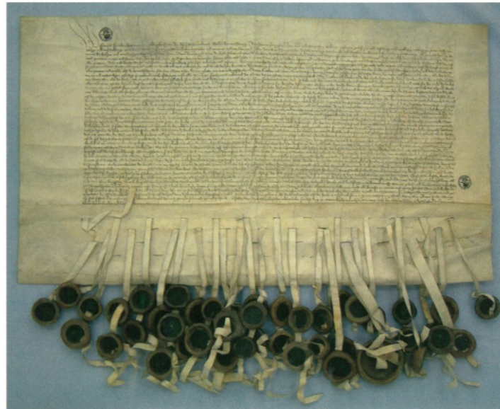
52. Dokument erekcyjny Związku Pruskiego