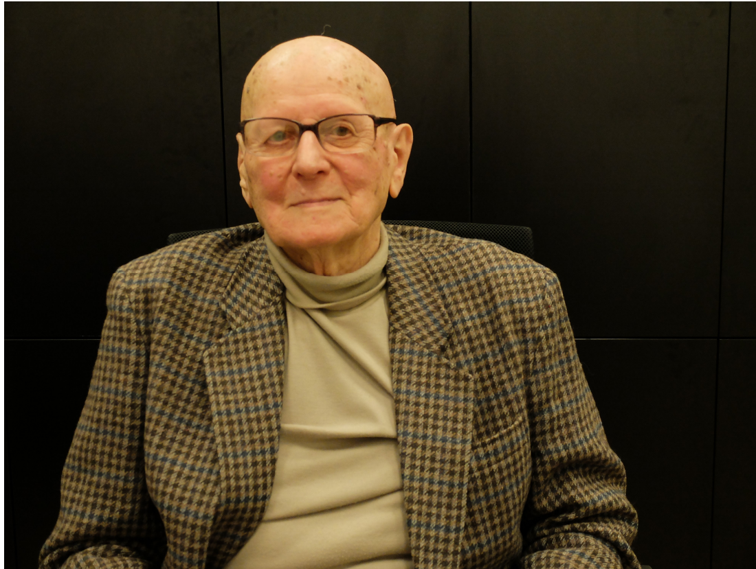
Filmový Zlín Karel Hutěčka (1927—2020)