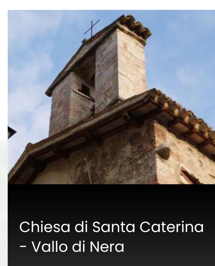
Chiesa di Santa Caterina - Vallo di Nera