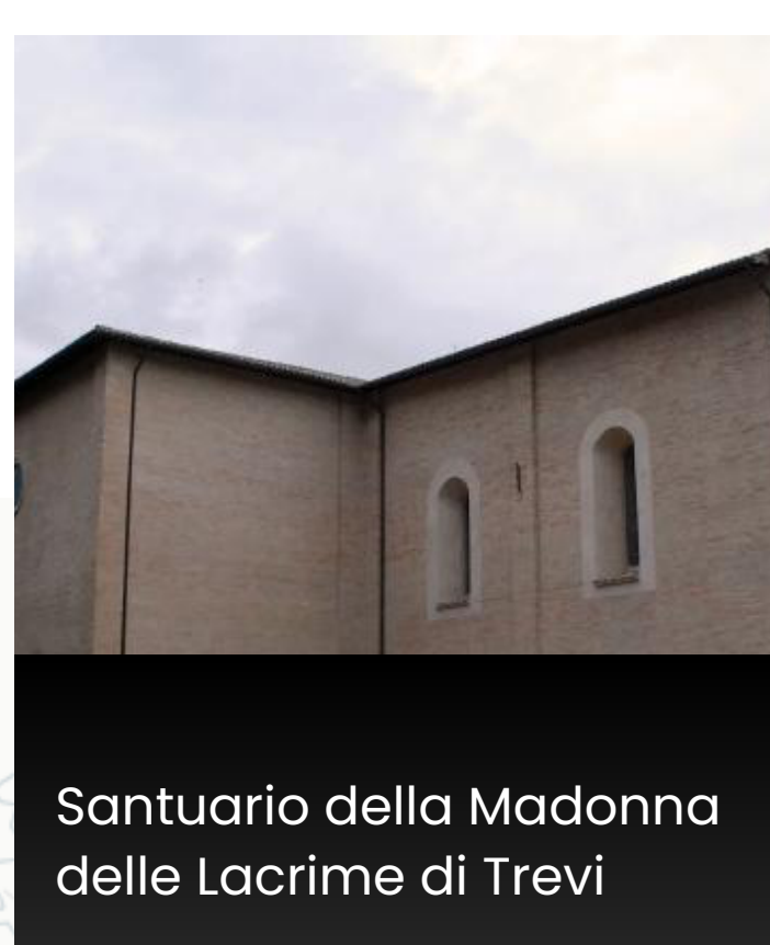
Santuario della Madonna delle Lacrime di Trevi