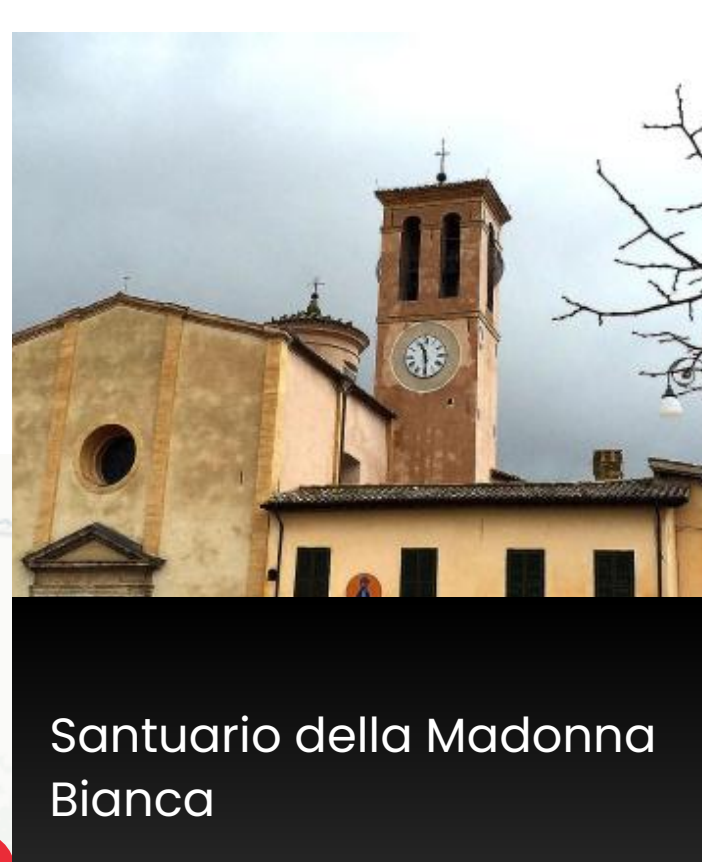
Santuario della Madonna Bianca