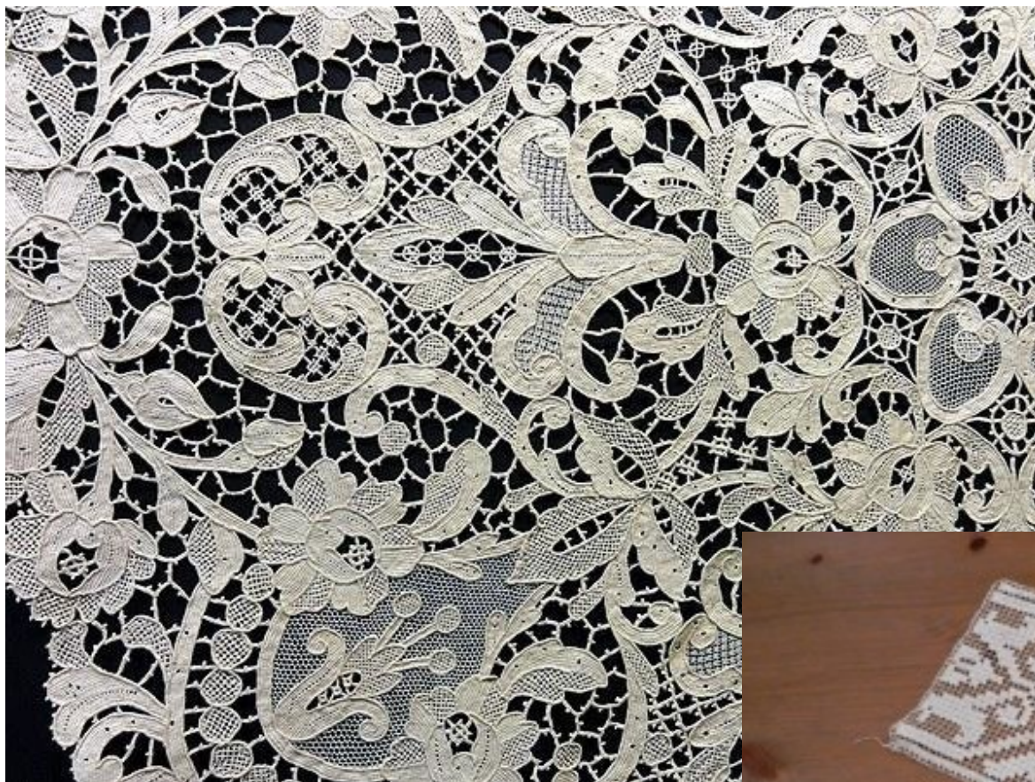
Textil – krajky zhotovené strojovým paličkováním, síťováním