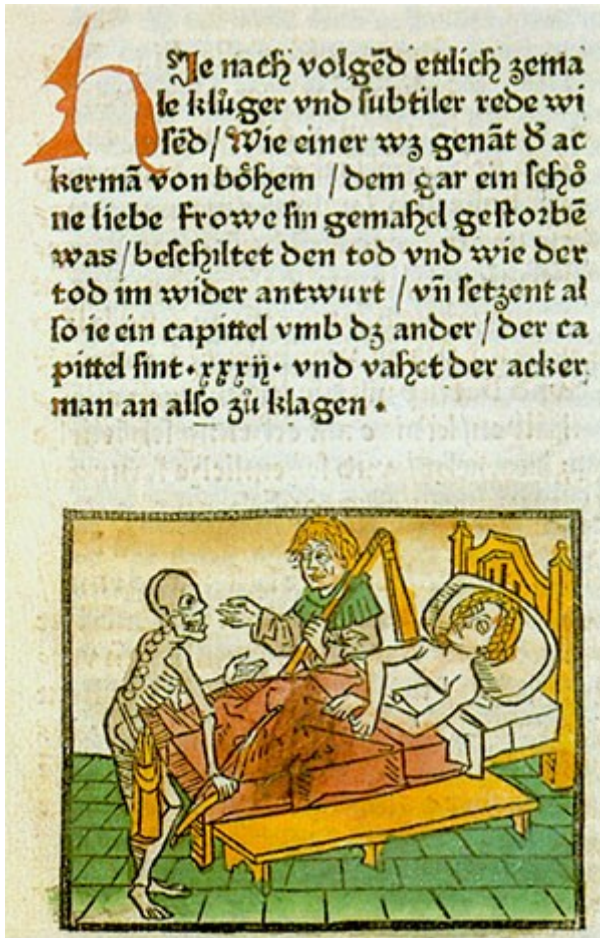
Titel des Basler Drucks von 1473 (Karlsruhe, Bad. Landesbibliothek)