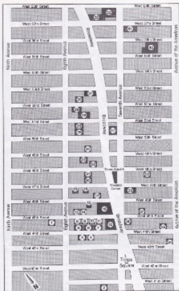
Broadway-, Off-Broadway-Theater und Veranstaltungsorte im New Yorker Theater-Distrikt um Broadway und Times Square