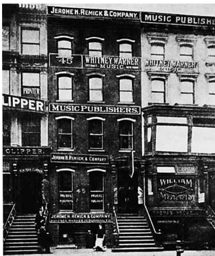
Tin Pan Alley roku 1910

Nacházíme mezi nimi i dva z Velké šestky Broadwaye – Gershwina a Berlina. Většinu z těchto standardů musí profesionální jazzman zahrát kdykoliv z paměti a pokud možno v libovolné tónině.