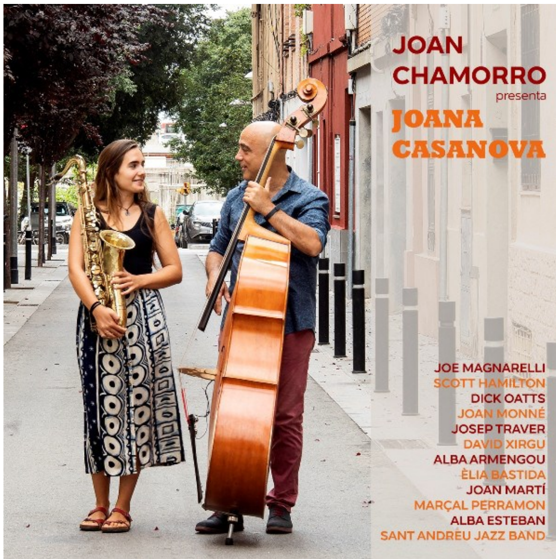
Jazz po katalánsku