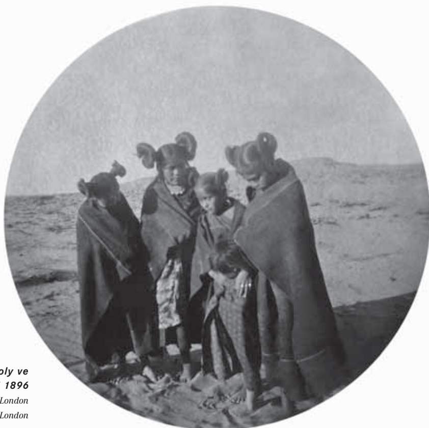
9 / Aby Warburg, dívky s drdoly ve tvaru sasaneek, Oraibi 1896