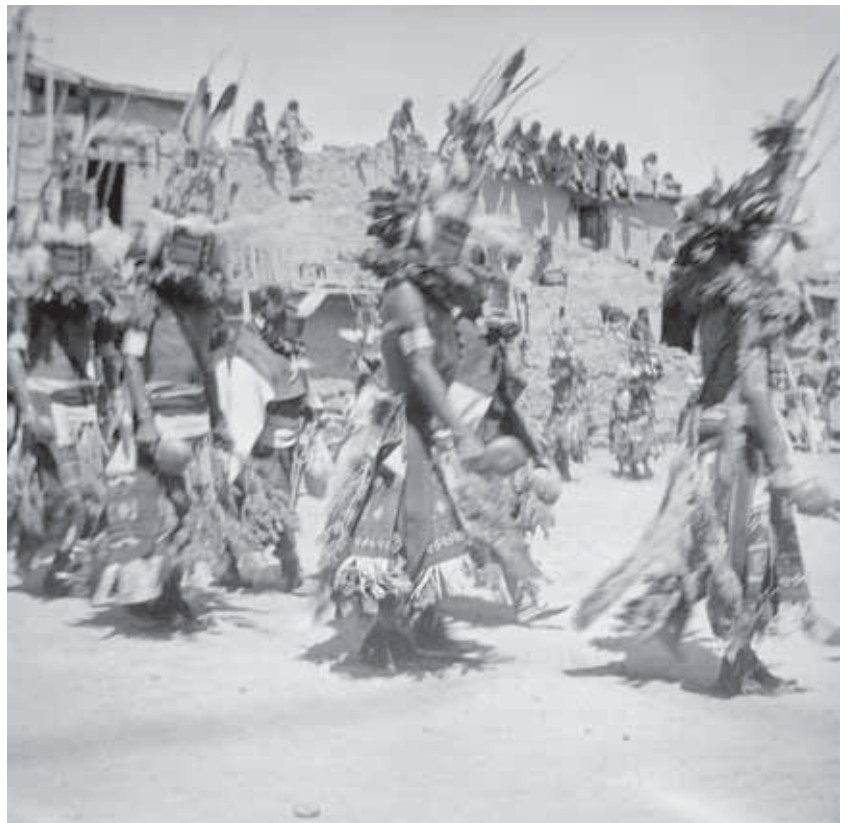
7 / Aby Warburg, tanec kačín Hemis, Oraibi 1896

Dříve než jsem se vydal na cestu, získal jsem převratně nové poznatky z oblasti psychologie vůle k zvířecí proměně od F. H. Cushinga, průzkumníka a veterána zápasu o poznání indiánské duše. Tento neštovicemi zjizvený muž, s prořídými narezlými vlasy, jehož věk se nedal odhadnout, mi s cigaretou v ústech vyprávěl, že mu jednou jeden Indián řekl: „Proč má člověk stát výše než zvíře? Podívej se na antilopu, která je celá v pohybu a běží o tolik lépe než člověk; nebo na medvěda, který je tak silný. Lidé dokážou jen část, čeho je schopno v úplnosti zvíře.“ Tento pohádkový způsob myšlení je předstupněm, jakkoli podivně to zní, k našemu přírodovědně genetickému vysvětlení světa. Neboť indiánští pohané vstupují stejně jako pohané na celém světě v uctivém strachu nebo v duchu toho,