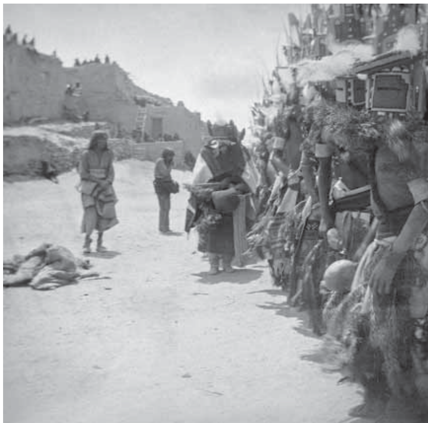
5 / Aby Warburg, tanečníci v maskách, Oraibi 1896

Schody a žebřík patří k prazkoušenostem lidstva pro každého, kdo chce znázornit zráná a jeho vzestupný a sestupný směr v přírodě. Symbolizují dosažený vze-