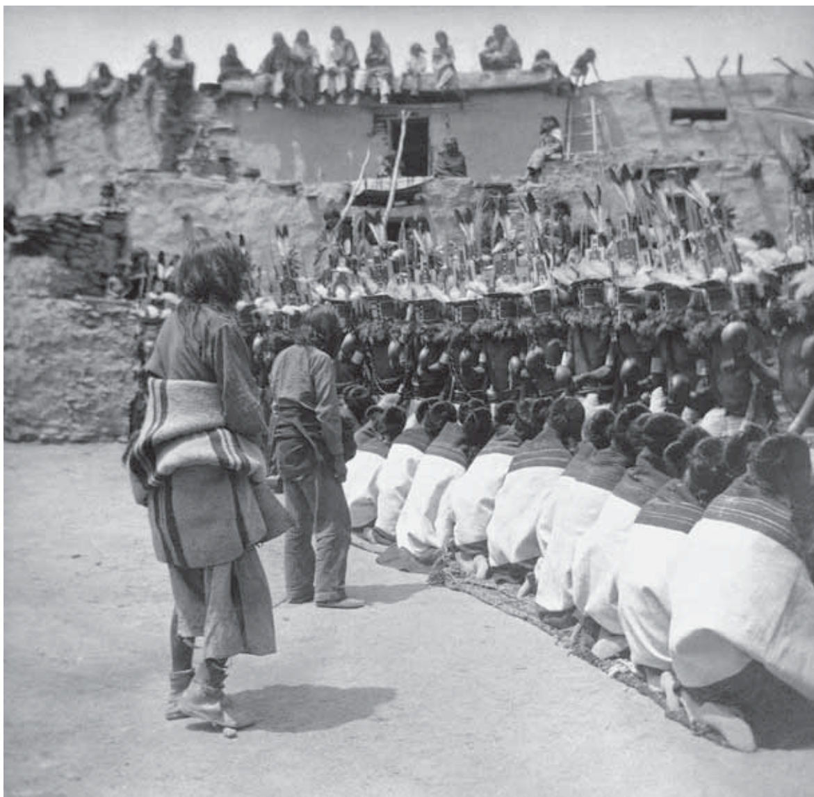
6 / Aby Warburg, Ženy sledující tanec kačín Hemis, Oraibi 1896