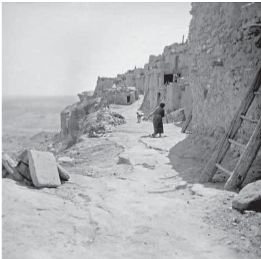
4 / Aby Warburg, Walpi, 1896