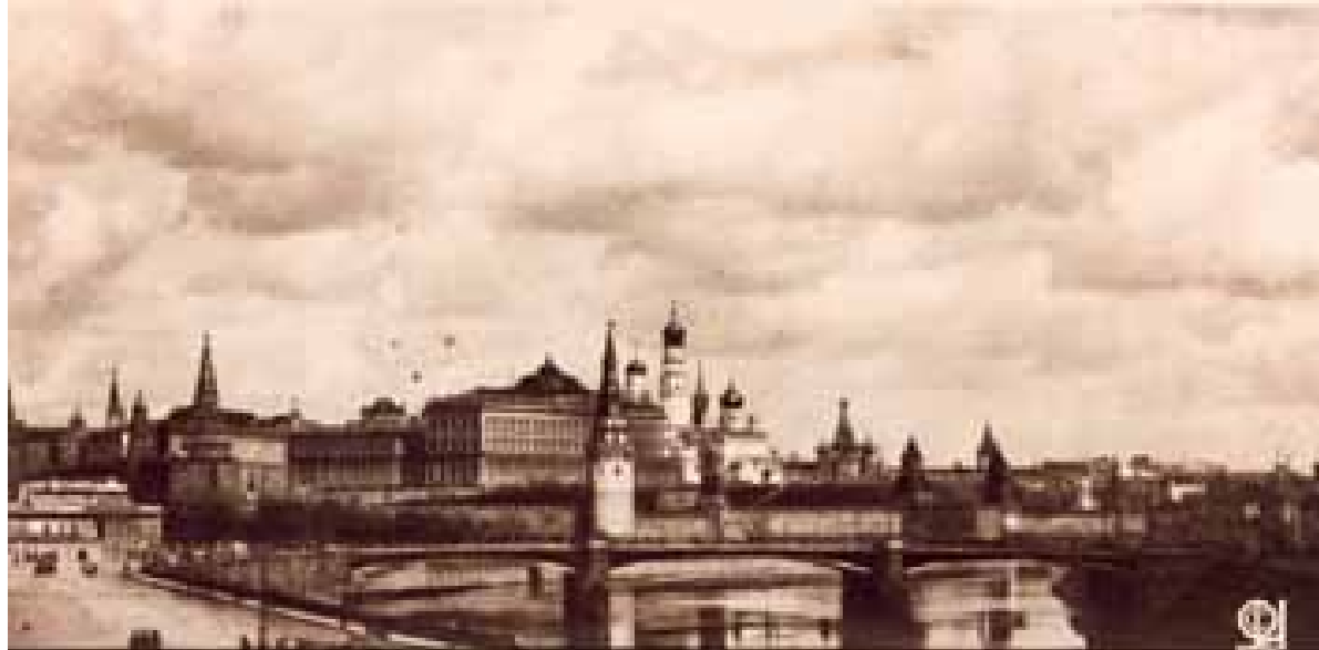
Москва. Кремль. Общий вид