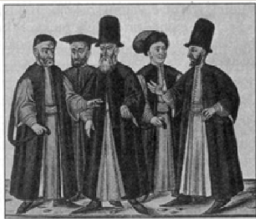
Konstantinopolský patriarcha s vyšším klérem (15. století)