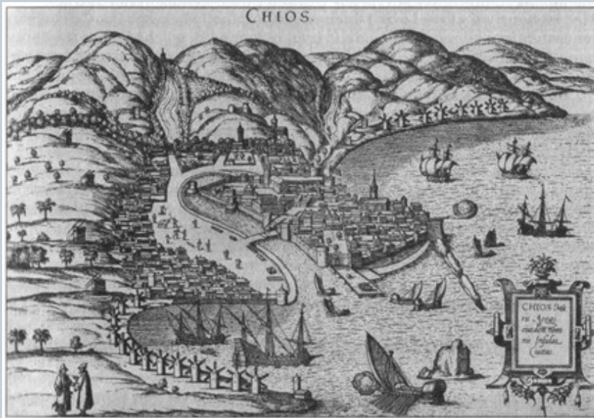
Chios – významné obchodní středisko