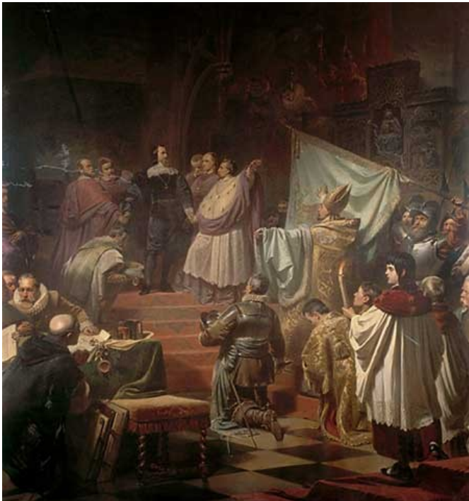
Karl Theodor von Piloty Založení Katolické ligy 1870 (detail)