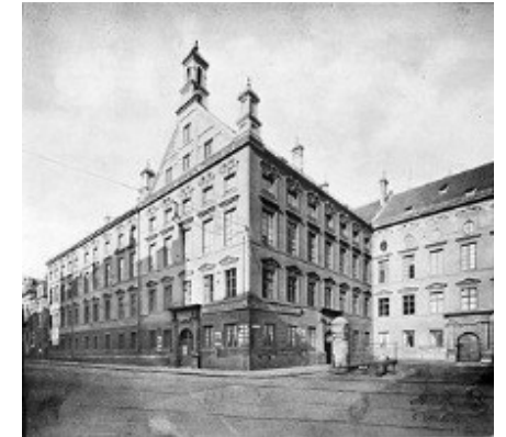
Původní sídlo akademie bývalá jezuitská kolej (Wilhelminum)