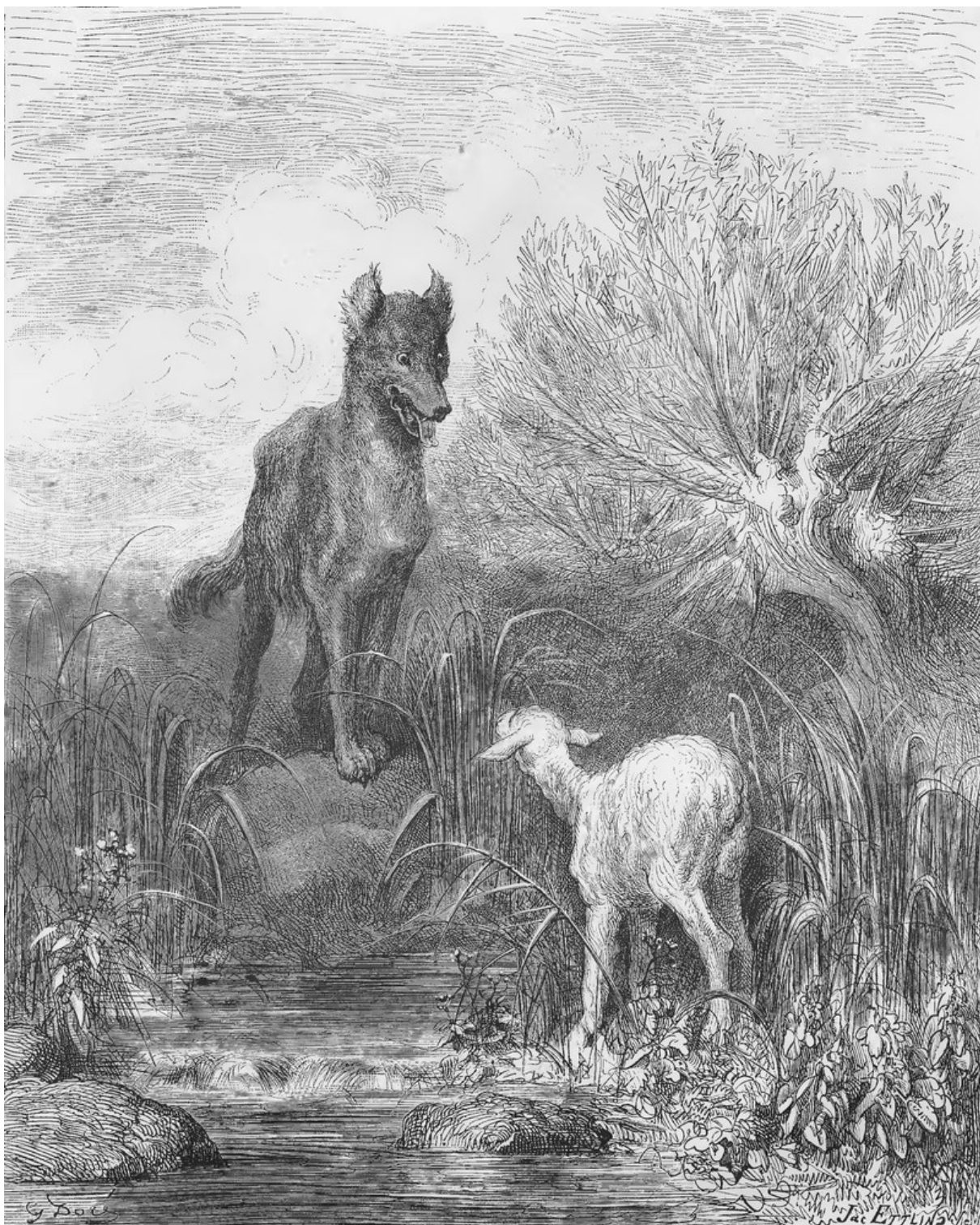
Ilustrace Gustava Doré (1832-1883) k bajce Vlk a jehně (1876)