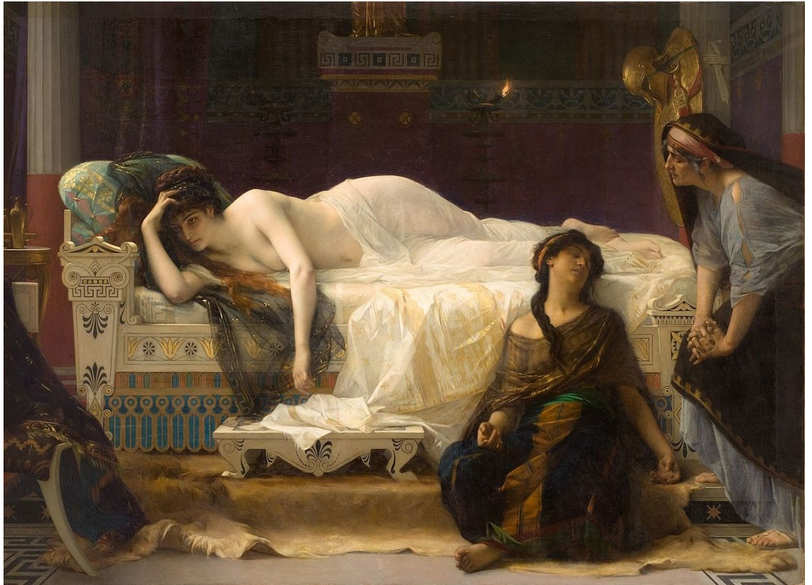
Alexandre Cabanel (1823-1889). Faidra (1880)

3. Jaký nejpádnější důkaz Hippolytos přináší, aby vyvrátil podezření z nemravné lásky?