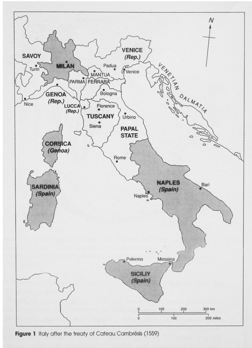
Mapa Itálie 1559

„Je jenom přirozené, že doby, kdy se měnily vlády a teritoria, zamíchala i životy jednotlivých lidí, kteří museli prchat a hledat útočiště v jiném městě, v jiném státě. Není možné zhustit zde všechny události a obraty, s jejichž ozvěnou se setkáváme v předhistoriích téměř všech italských komedií. Ztracené děti, rozloučení milenci, otcové i synové, kteří žijí pod jiným jménem v novém domově mimo svou vlast, takže se dlouho marně hledají, ty všechny těžko uvěřitelné zápletky mají svůj kořen ve skutečných událostech, které jim dodaly jistou míru pravděpodobnosti.“ (Zdeněk Digrin)