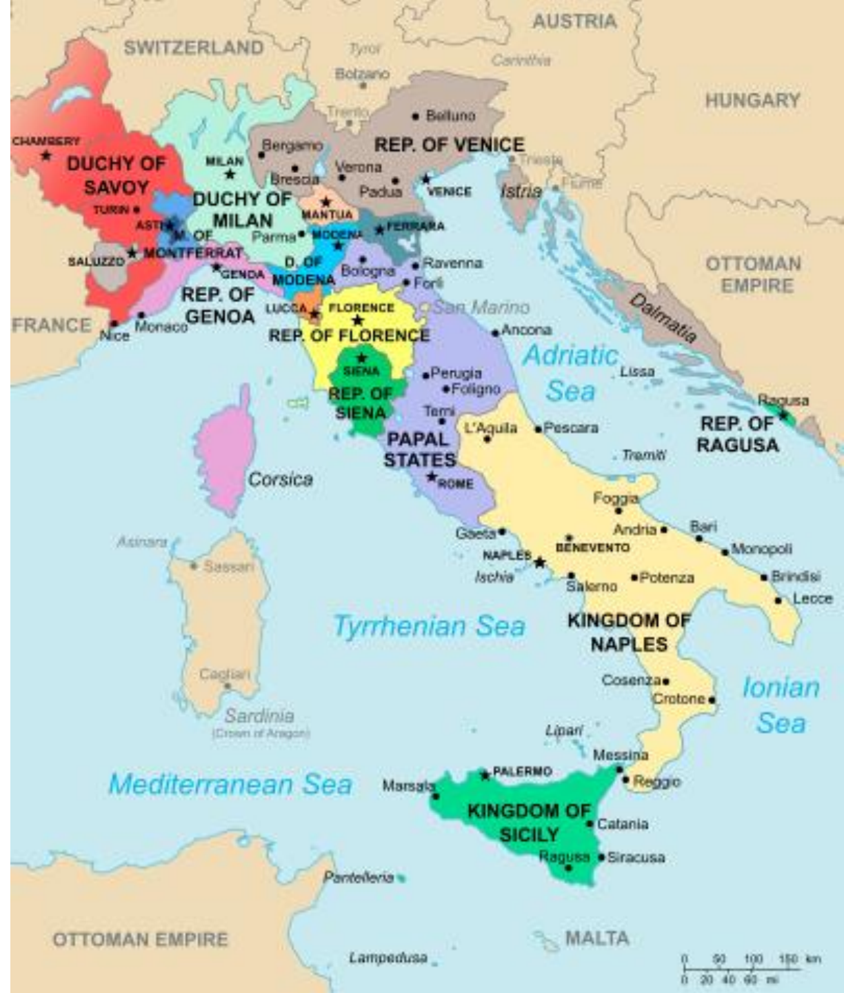
Mapa Itálie před válkami

https://www.youtube.com/watch?v=G6AYGaJVieQ