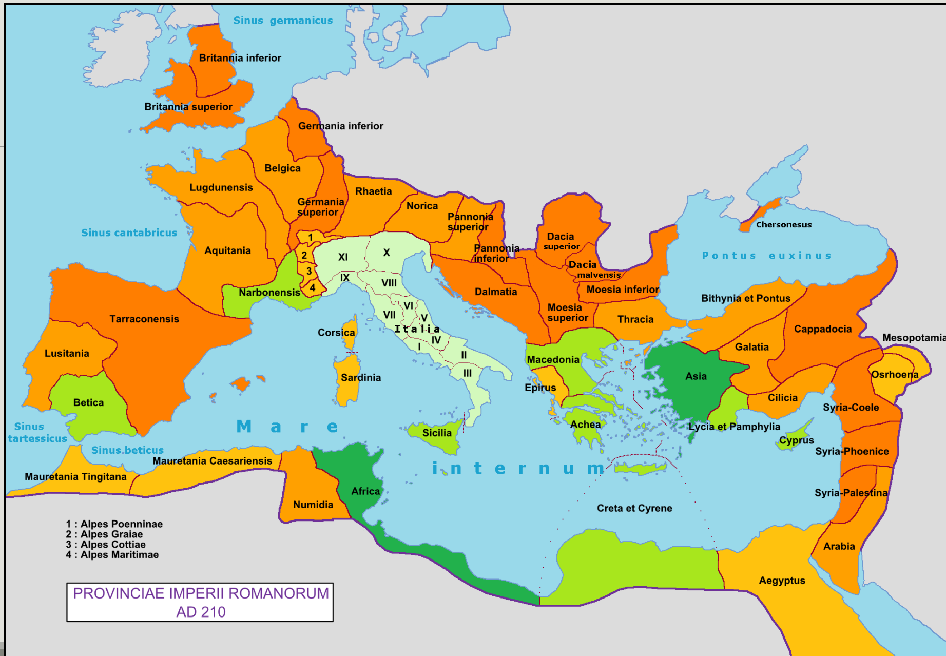
PROVINCIAE IMPERII ROMANORUM AD 210