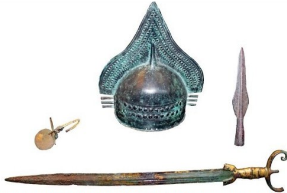
Equipment of an aristocratic warrior, late 9th century BC, from grave Monterozzi 3, Arcatelle necropolis, Tarquinia. These splendid finds are a Villanovan bronze crested helmet, a spearhead, an 'antennae' sword, and a fibula brooch. (National Archaeological Museum, Tarquinia)