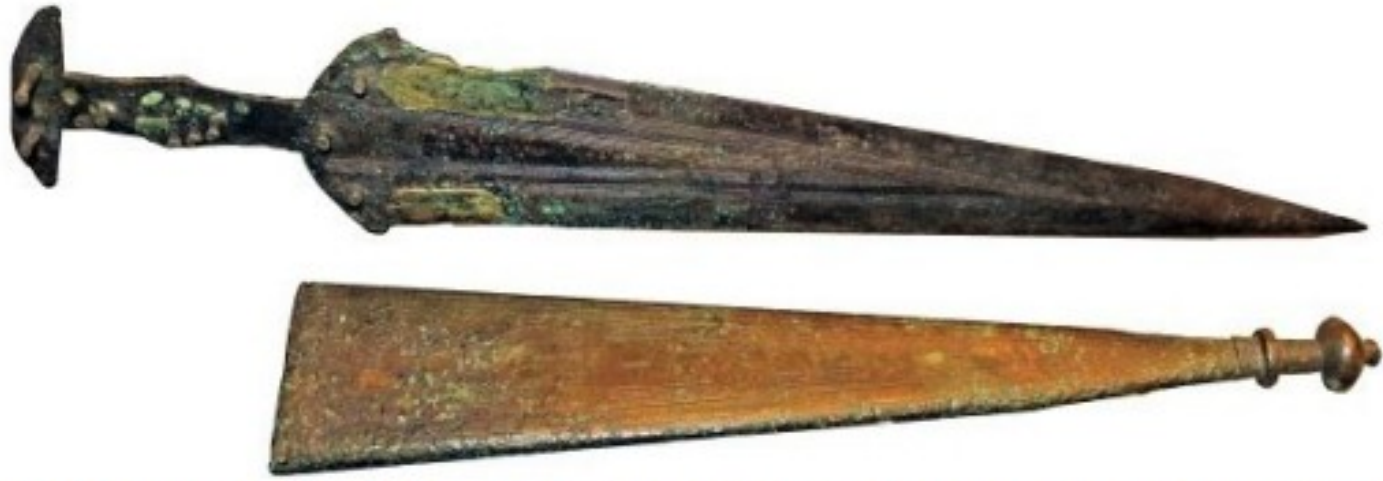
'Triangular' sword with tang ending in 'T'-shape, and bronze scabbard; first half of 8th century BC, from the Monterozzi necropolis, Tarquinia. (National Archaeological Museum, Tarquinia)