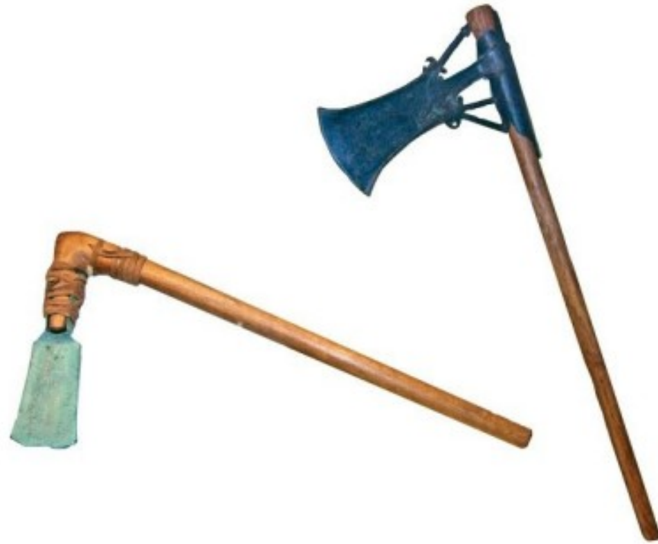
Bronze war axes, from Cortona: (left) 'winged' axe, so called from the shape at the shoulders, 10th century BC; (right) 'socketed-eye' decorated axe, 7th century BC. (Museo dell'Accademia Etrusca e della città di Cortona)