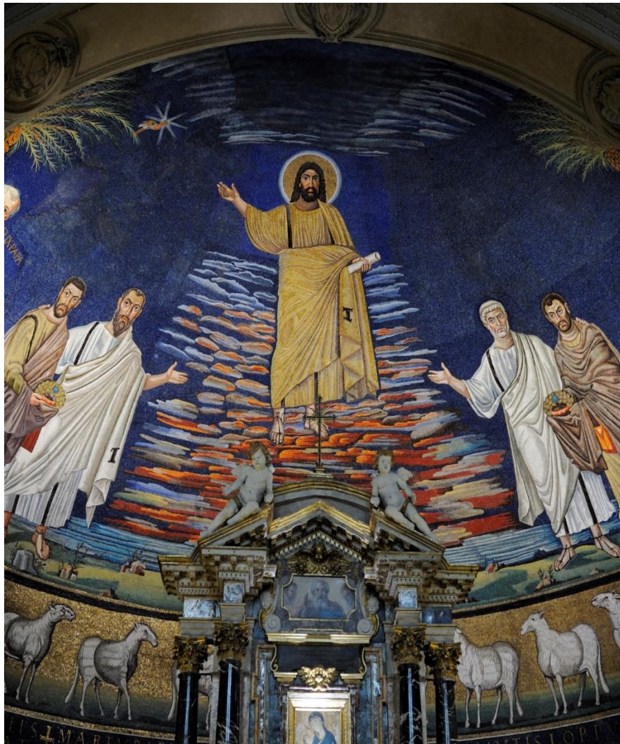
Bazilika svatého Kosmy a Damiána, Řím, 526–530