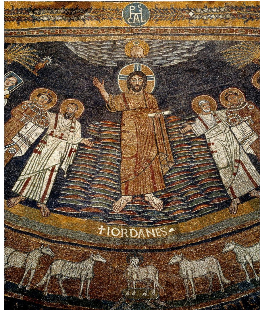
Santa Prassede, Řím, 817–824