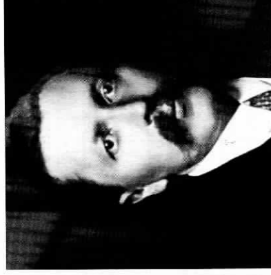
Vlastimil Tusar, první československý sociálnědemokratický předseda

K prioritám při budování československého státu patřil také vznik demokratické, jednotné a moderní státní správy, jehož výrazem byl i zákon o správním zřízení z roku 1920. Původně se předjímal zavedení župního samosprávného zřízení, předpokládajícího vznik 21 žup, z toho 6 na Slovensku. Problém však představoval fakt, že minimálně 2 župní oblasti byly většinově německé, a župy byly tedy zřízeny pouze na Slovensku. V roce 1927 tento nejednotný systém nahradilo zemské zřízení, jehož základem bylo rozdělení republiky na jednotlivé země – Českou, Moravskoslezskou, Slovensko a Podkarpatskou Rus s vlastními samosprávnými zemskými zastupitelstvy. 338