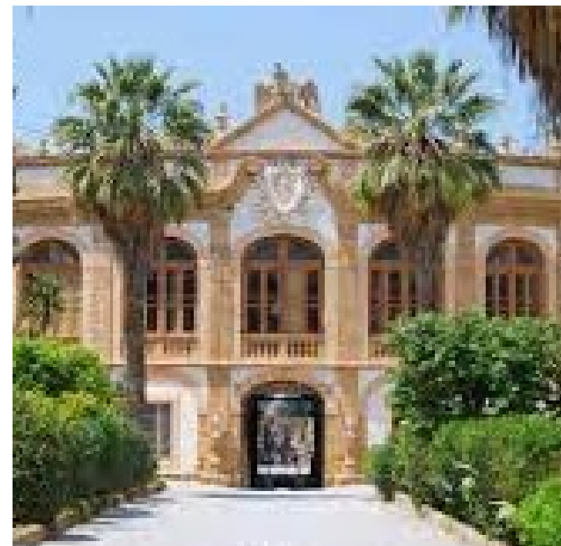
Villa Valguarnera La villa più sontuosa, 1714, situata in un parco enorme