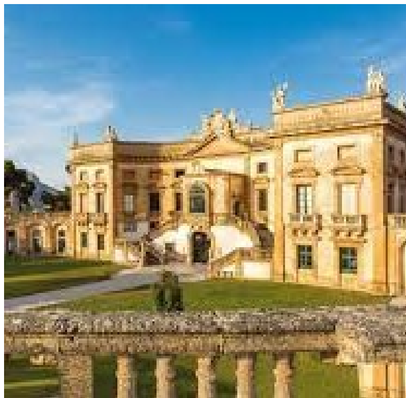
Villa Palagonia 1715 da Tommaso Napoli per Francesco Gravina