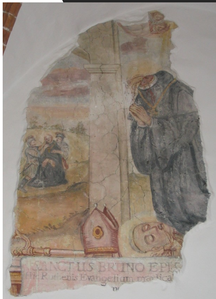
Smrt sv. Bruna