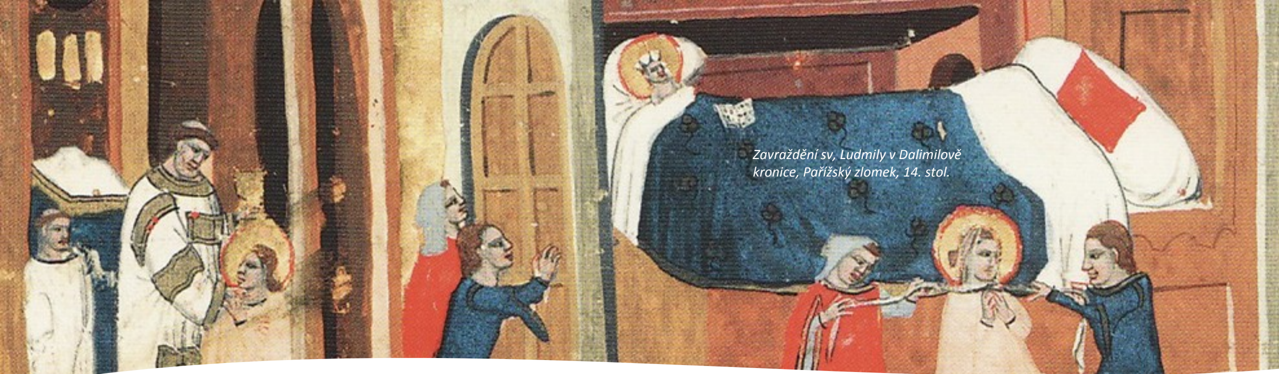
Zavraždění sv. Ludmily v Dalimilově kronice, Pařížský zlomek, 14. stol.