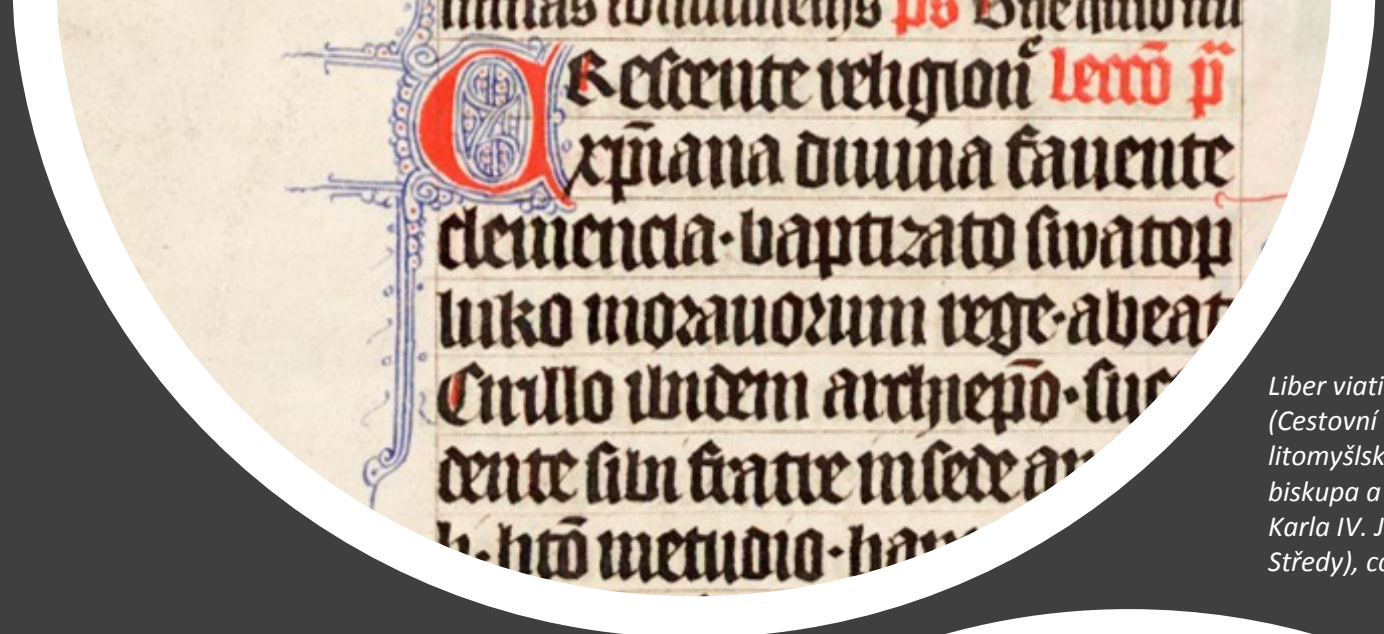
Liber viaticus (Cestovní breviář litomyšlského biskupa a kancléře Karla IV. Jana ze Středy), cca 1360