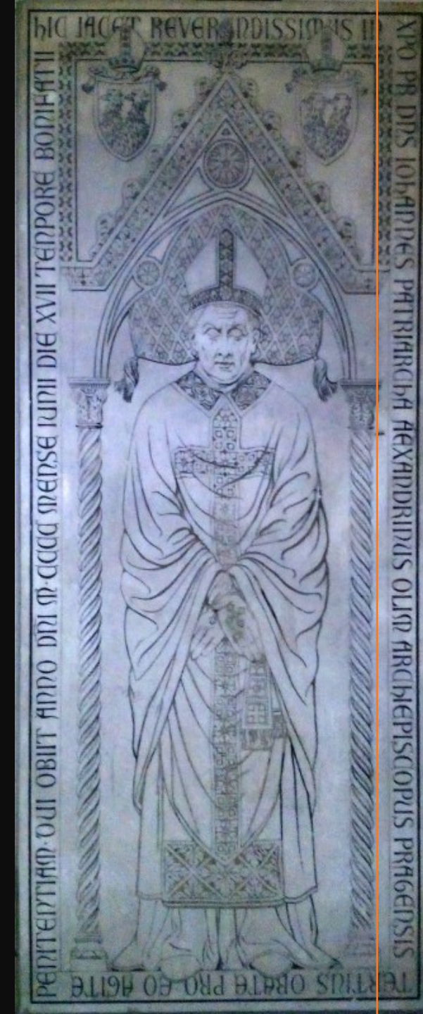
Náhrobek Jana z Jenštejna v bazilice Santa Prassede v Římě