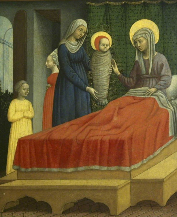
Ant. Vivarini (+1484): Narození sv. Augustina