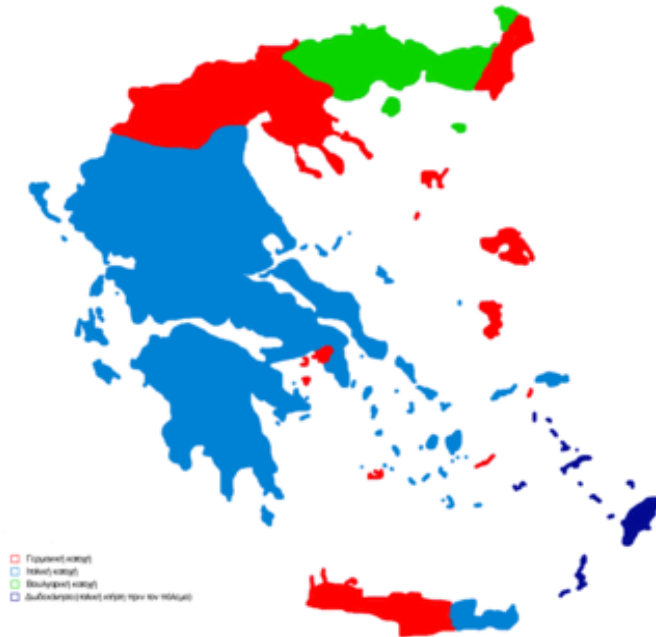
Τριπλή κατοχή της Ελλάδας από τις Δυνάμεις του Άξονα (1941-1944)

Následky okupace: hladomorem a nemocí umírá 0,5 milionů Řeků, tj. 7% celkového obyvatelstva. Zničeno 1.700 vesnic, 1,2 milionů lidí bez domova, 60.000 řeckých židů umírá v koncentračních táborech. Řecko totálně vydrancované nacisty.