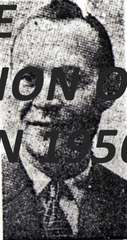
ΟΝΕΟΕΚΛΕΓΜΕΝΟΣ ΠΡΩΤΟΣ ΓΡΑΜΜΑΤΕΑΣ ΤΗΣ ΚΕ ΤΟΥ ΚΚ ΤΣΕΧΟΣΛΟΒΑΚΙΑΣ