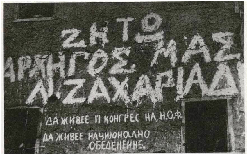
Στην τελευταία φάση του Εμφυλίου, επί 22.000 ανταρτών οι 14.000 ήταν Σλαβομακεδόνες. Στο Βίτσι τα συνθήματα γράφονταν και στις δύο γλώσσες.

The defeat of DSE had a serious impact on the Slav population of northern Greece.