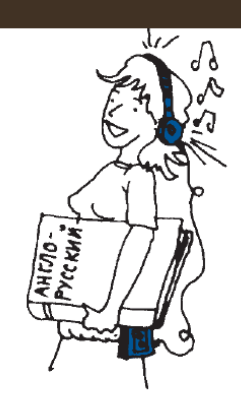
5. Это Анна. Что у неё есть?