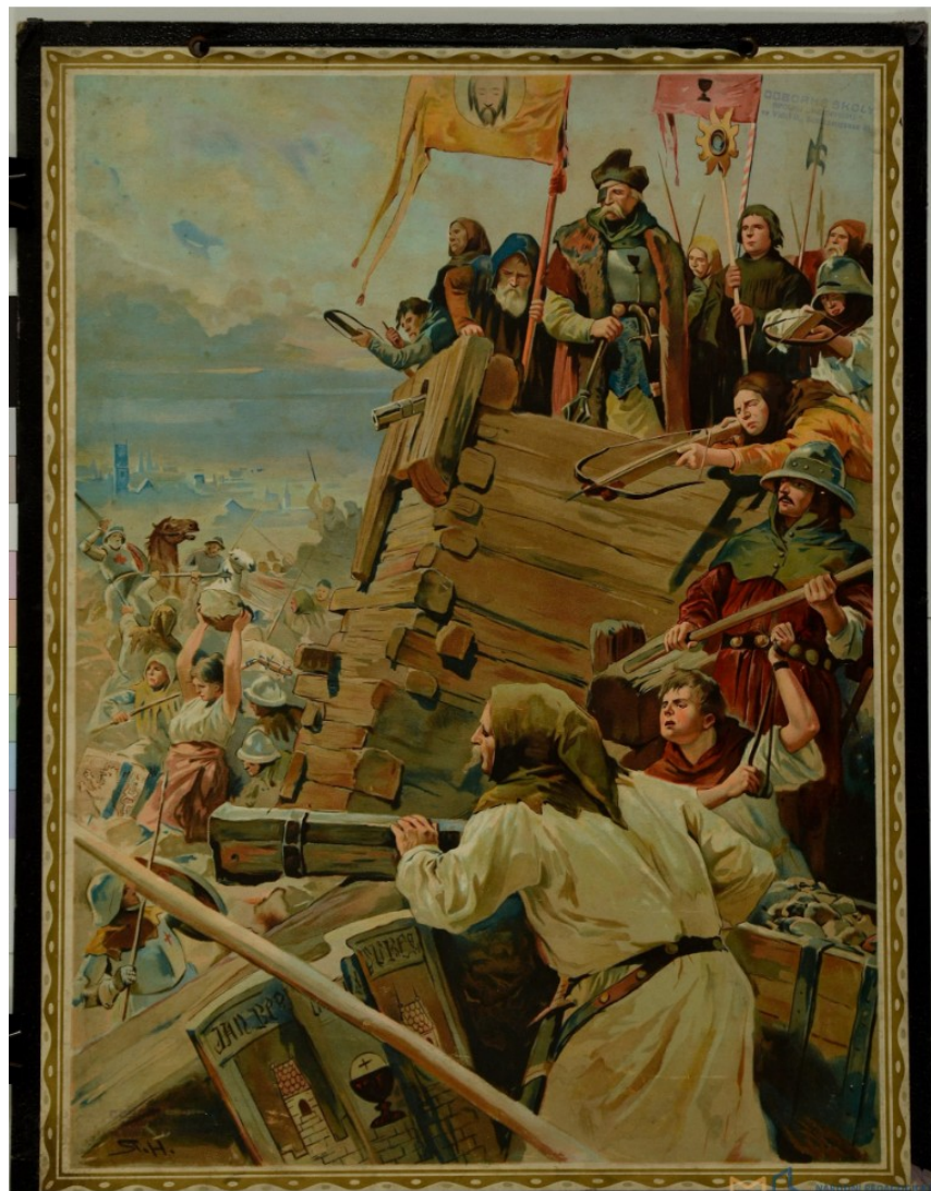
Žižka s bojovníky na hradbách. 1. tř. 20. st.