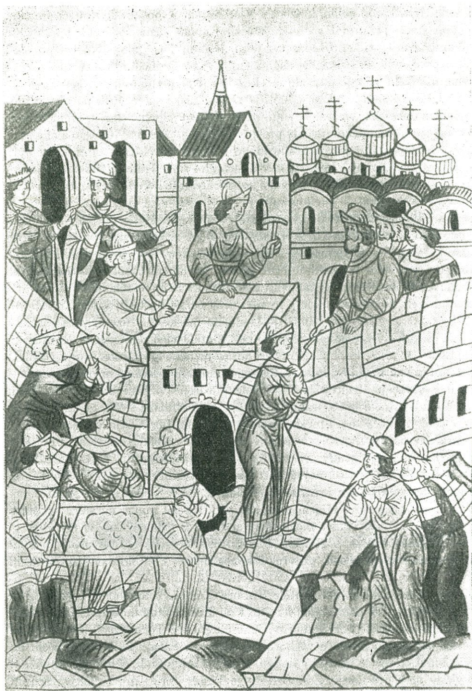
Stavba kamenného kremlu v Moskvě r. 1367. Miniatura z letopisného svodu ze 16. stol.

a veliký kníže Vasil vytáhl do boje proti němu. Nestřetli se však, protože Timur změnil z neznámých důvodů směr svého pochodu.