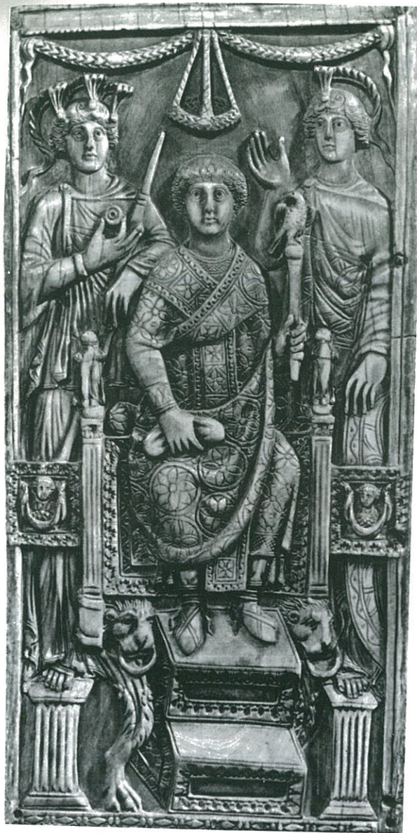
Consul Magnus (řezba ve slonovině z roku 518)

Itálie a na Sicílii. Přesídlení Řeků do těchto dvou vzdálených západních oblastí byzantské říše se pak výrazně obrazilo v jejich dalším vývoji tím, že se do značné míry počítily po stránce jazykové, kulturní i náboženské.