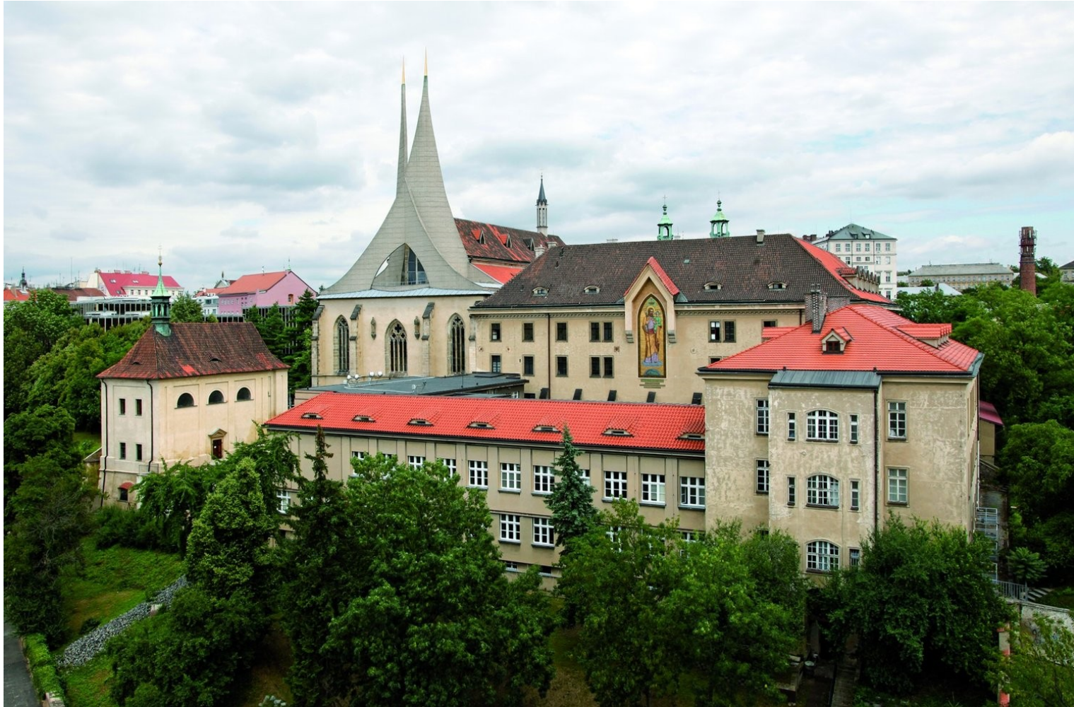
15 Svátí a jejich kult ve středověku