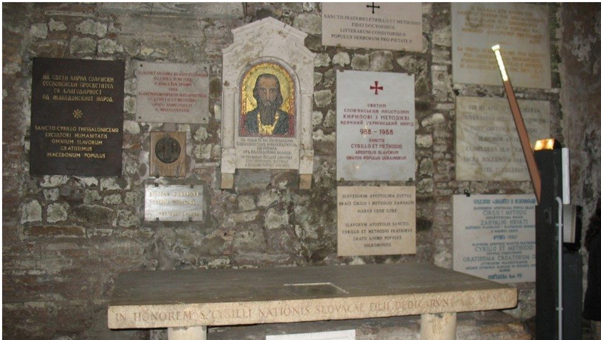
7 Svatí a jejich kult ve středověku