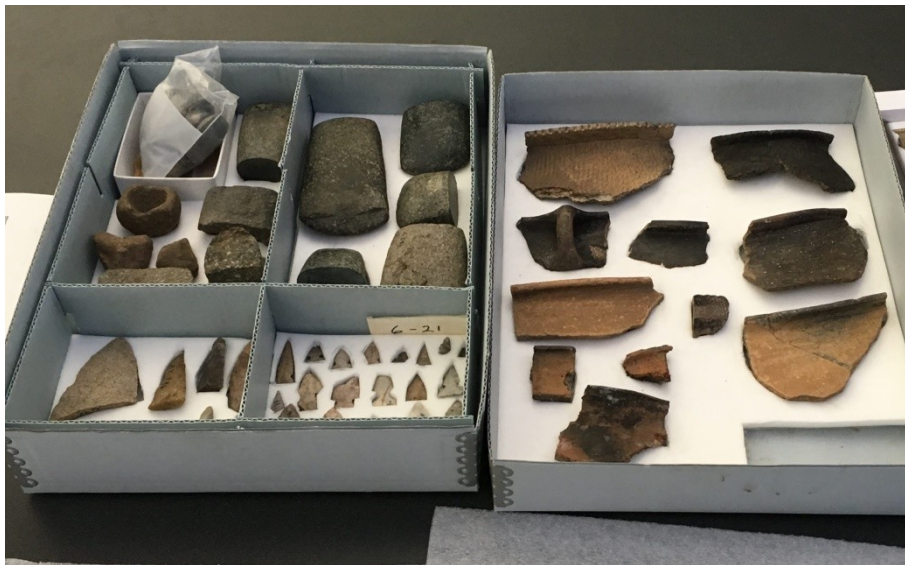
Keramické střepy vhodně uložené, ale nerestaurované

Archeologický nález stabilizovaný utěsněním v obalu při nízké RV