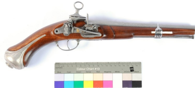
Restaurování – doplnění replik poškozených dílů a kompletace artefaktu?