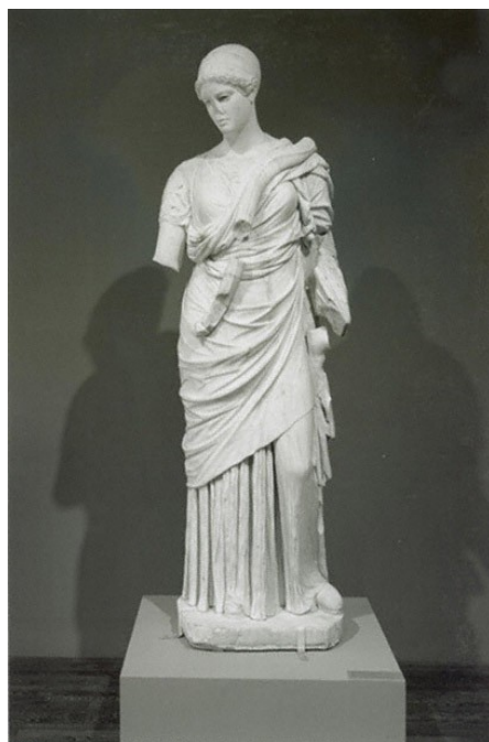
De-restaurování v r. 1973