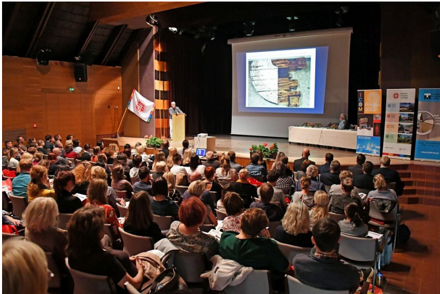
Konference konzervátorů-restaurátorů, 2019, Rožnov p. Radhoštěm