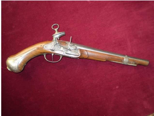
Pistole jezdecká, r. 1704, SNM, stav před požárem