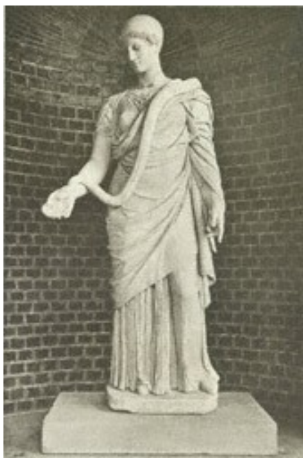
Restaurování kolem r. 1800

Interdisciplinární konzervování- restaurování