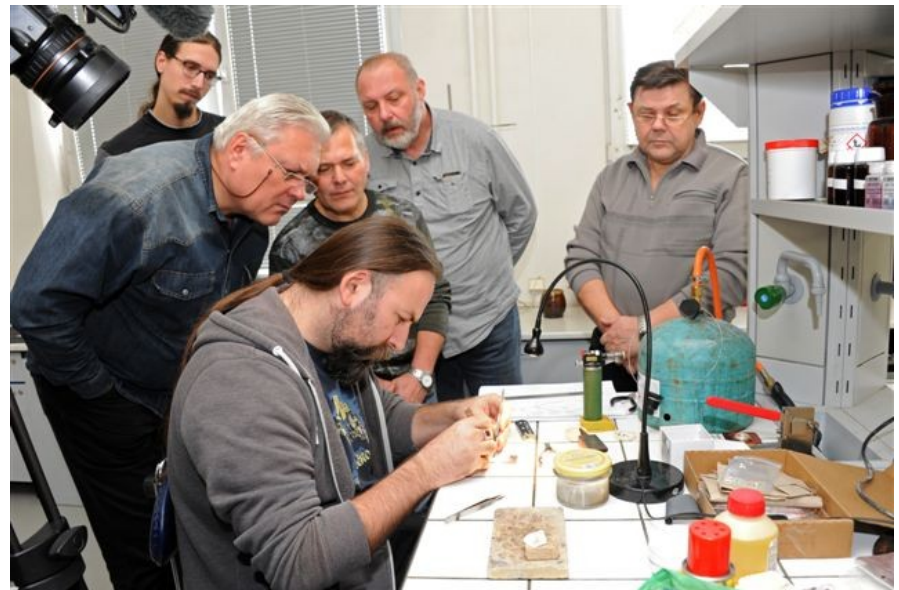
Workshop emailování, 2017, MCK TMB