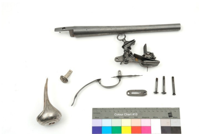
Sanační konzervace – očištění a stabilizace pouze originálních dílů?