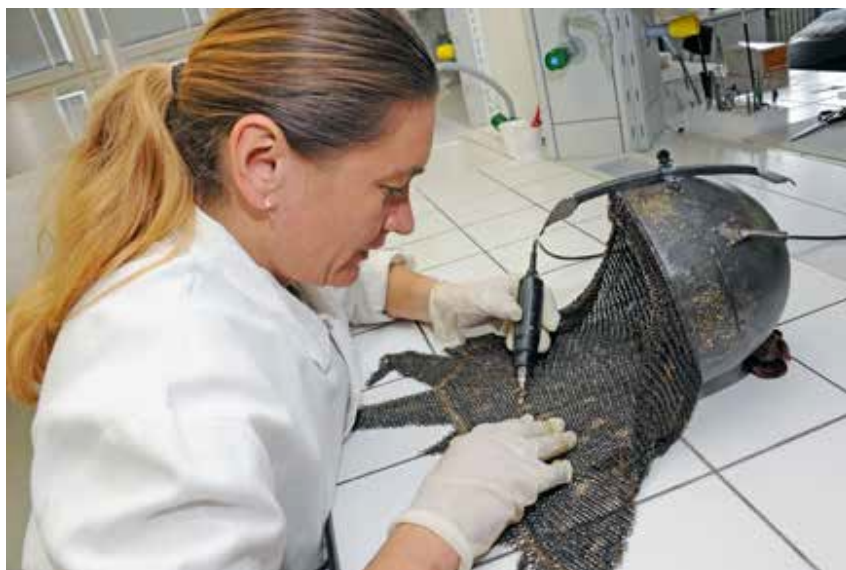
Konzervování-restaurování orientální přilbice, MCK TMB, 2015