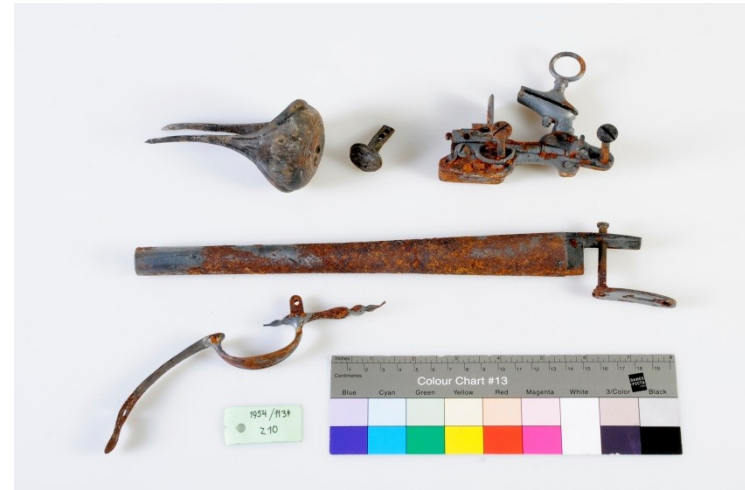
Stav po požáru na hradě Krásna Hôrka, r. 2012 - Preventivní konzervace – ponechání fragmentů in-situ?