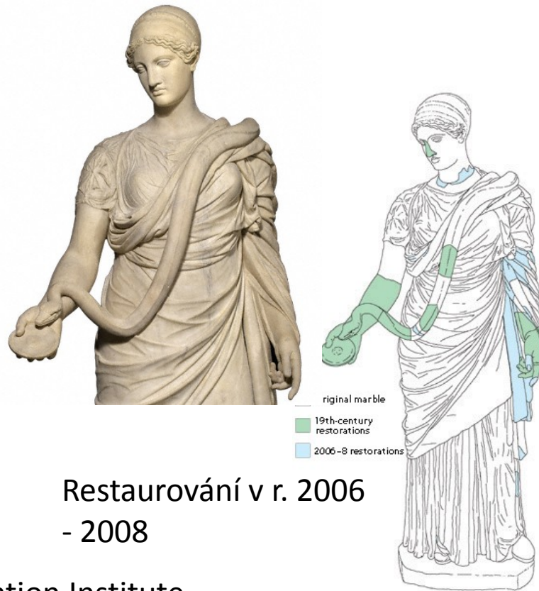
Restaurování v r. 2006 - 2008

Restaurování sochy – Bohyně zdraví , The Getty Conservation Institute The Hope Hygieia , Roman, A.D. 140–160.