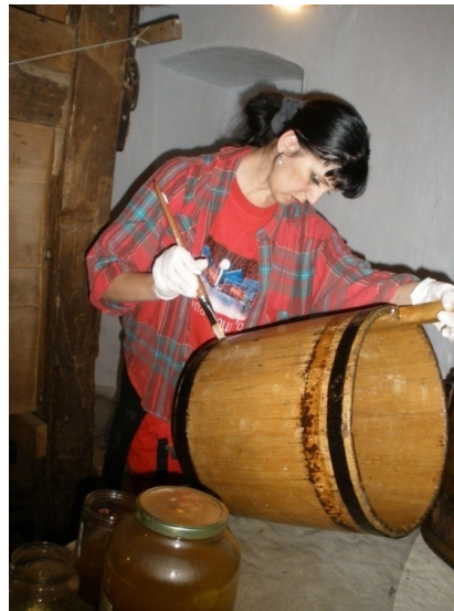
SK: Chemická desinsekce