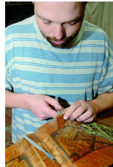
R: Doplnění intarzie