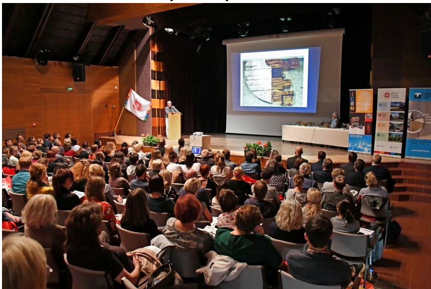
Konference konzervátorů-restaurátorů, 2019, Rožnov p. Radhoštěm