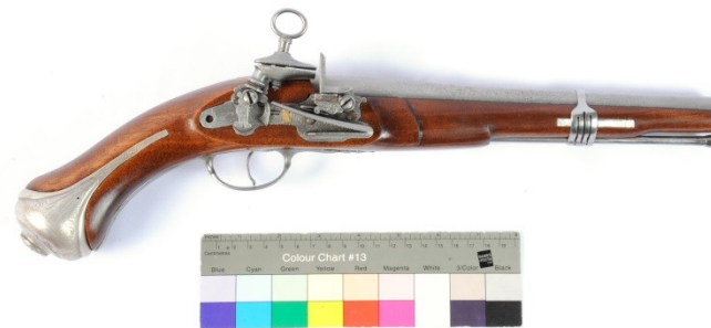
Restaurování – doplnění replik poškozených dílů a kompletace artefaktu?