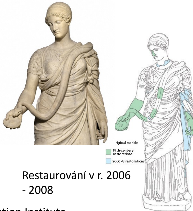
Restaurování v r. 2006 - 2008

Restaurování sochy – Bohyně zdraví , The Getty Conservation Institute The Hope Hygieia , Roman, A.D. 140–160.