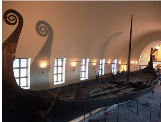
Muzeum vikingských lodí