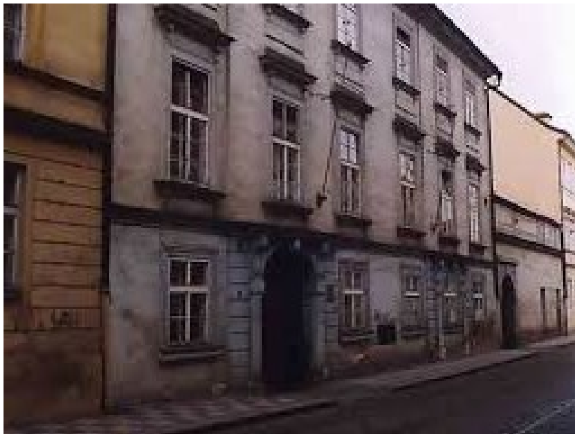
Ústav pro jazyk český AV ČR, Letenská 4, Praha