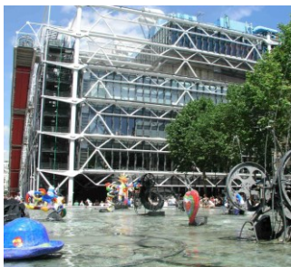
Centre Georges Pompidou 1977, Renzo Piano, Richard Rogers (Jan Kaplický)