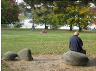
Brněnská přehrada Sochařský park (???)