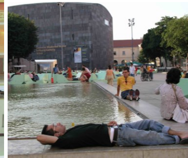
MUMOK – Muzeum moderního umění ve Vídni