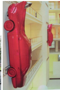
Veletržní palác Oldřich Tyl Josef Fuchs