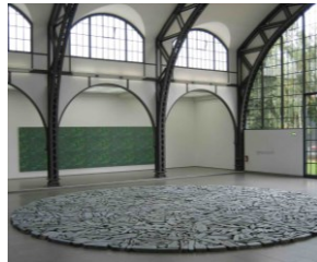
Hamburger Bahnhof Muzeum v bývalém nádraží