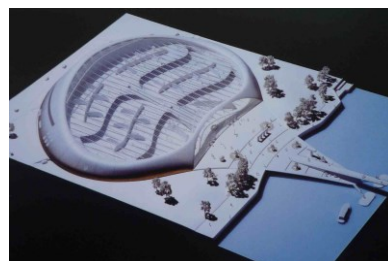
Tate Modern – nerealizovaný projekt Jana Kaplického