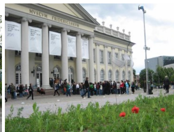
Museum Fredericianum Kassel („documenta“)