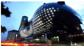
Kunsthau Graz – „Friendly Alien“ Peter Cook, Colin Fournier, 2003