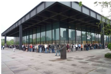
Neue national Galerie, Berlín Ludwig Mies van der Rohe 1968