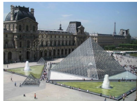
Louvre, dostavba vstupu Ieoh Ming Pei, 1989