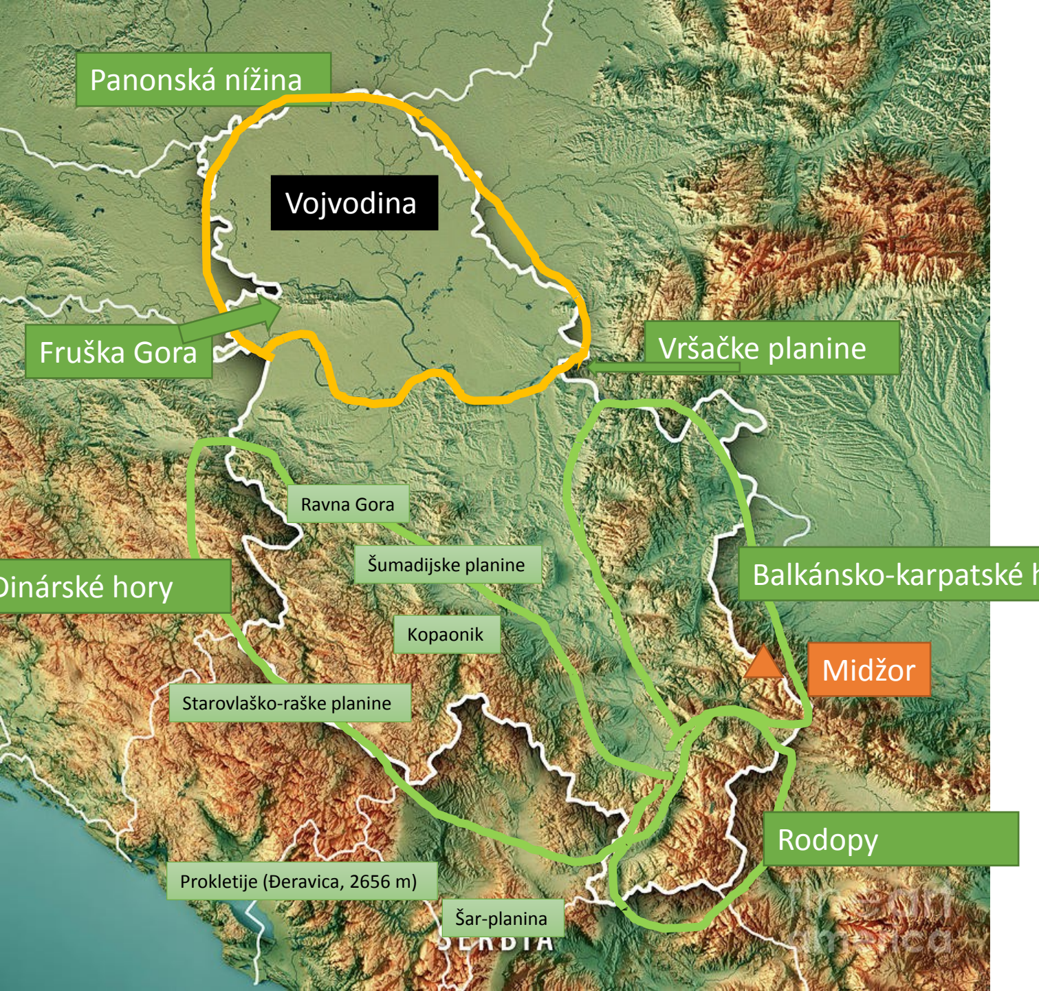
Midžor (Миџор), 2169 m