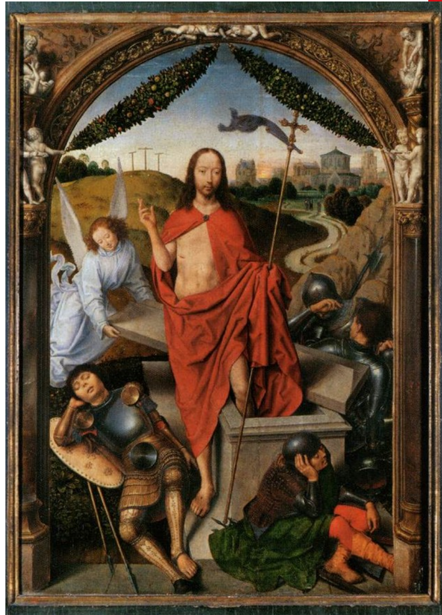
Hans Memling (cca. 1430-1492); Kristovo vzkříšení, cca. 1490