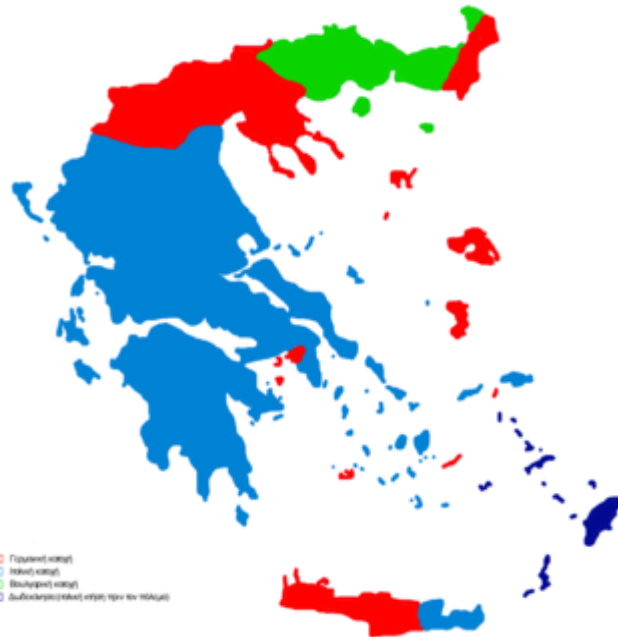
Τριπλή κατοχή της Ελλάδας από τις Δυνάμεις του Άξονα (1941-1944)

Následky okupace: hladomorem a nemocí umírá 0,5 milionů Řeků, tj. 7% celkového obyvatelstva. Zničeno 1.700 vesnic, 1,2 milionů lidí bez domova, 60.000 řeckých židů umírá v koncentračních táborech. Řecko totálně vydrancované nacisty.