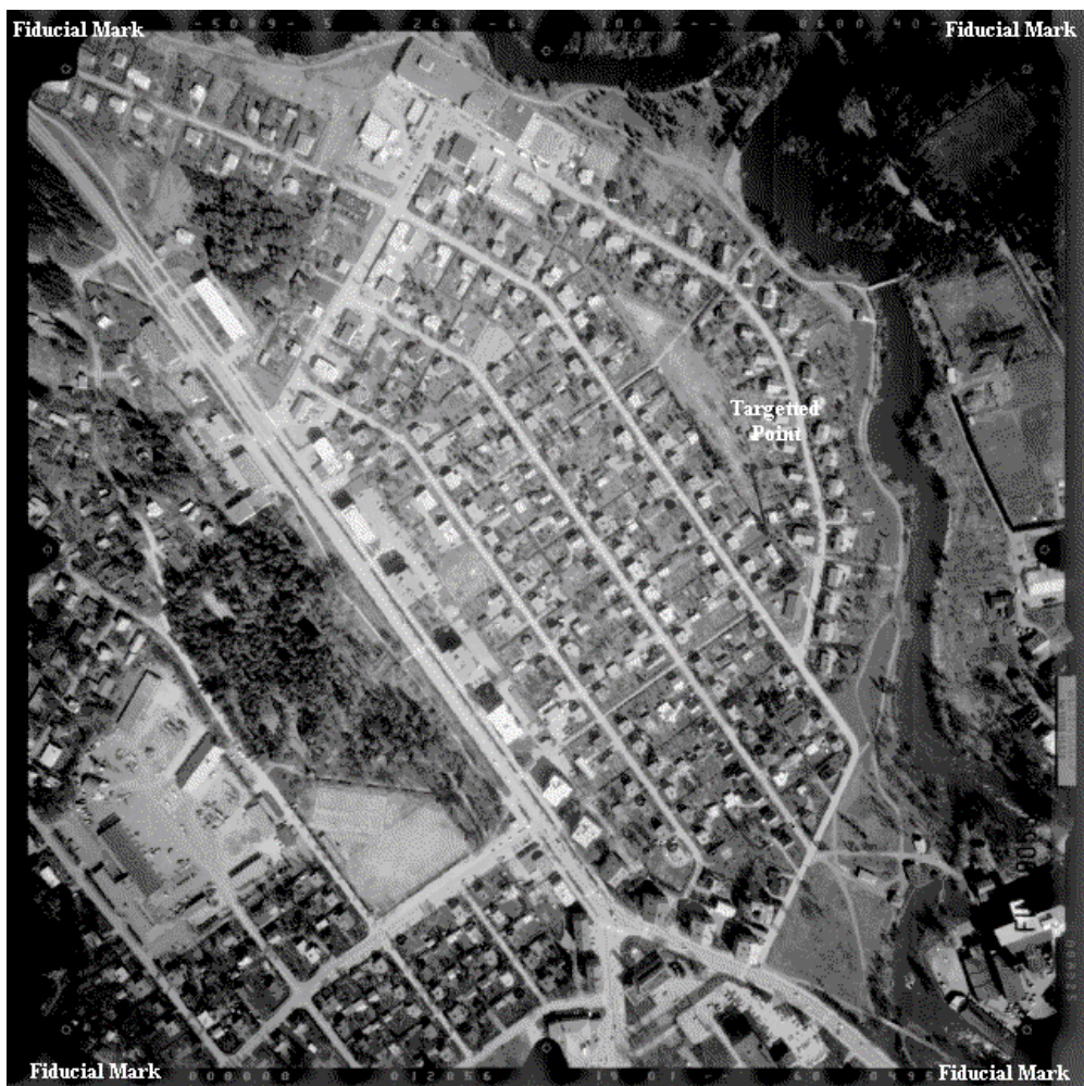
Obr. 1.1 Letecký měřický snímek

Fotogrammetrie je měřická metoda umožňující modelování v 3D prostoru s využitím 2D snímků. (Kasser, Egels, 2002)