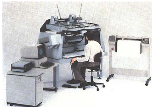
Obr. 1.5 Analytický stereoplotter

Analytická fotogrammetrie – 1960 – 1980, 1957 – Helava – princip analytického vyhodnocovacího přístroje.