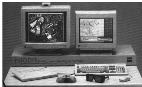
Obr. 1.6 Digitálních fotogrammetrická stanice

Digitální fotogrammetrie – použití digitálních snímků zpracovávaných pomocí VT, vytvoření prvních digitálních fotogrammetrických pracovních stanic (DPW), 90. léta 20. století. Nejprve spec vybavení (Imagestation , OS CLIX), dnes na běžných stolních počítačích.