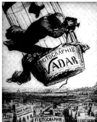
Obr. 1.3 Fotografie z balónu, NADAR, 1858

Vývoj fotogrammetrie byl ovlivněn vynálezem fotografie, rozvojem letectví, jemné mechaniky, optiky, výpočetní techniky. Její počátky se však datují hluboko v minulosti, ještě před vynálezem fotografie.