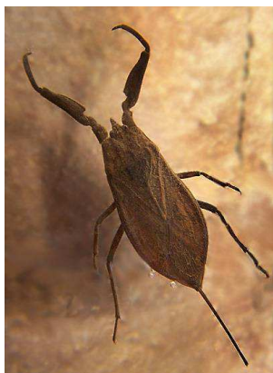
Nepa cinerea – spleštule blátivá, zarostlé vody