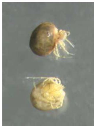
(vodní roztoči) 0,2 cm