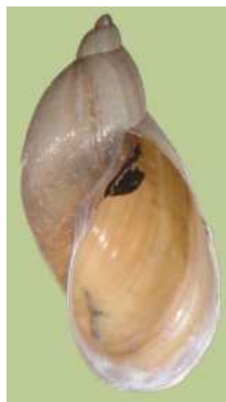
Radix (Lymnaea) – plovatka, do 1,7 cm nemá víčko v ústí