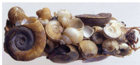
Limnephilus - do 1,5 cm schránky měkkýšů, úkrojky vegetace – stoj. vody