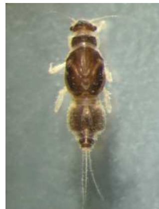
Caenis - do 0,8 cm, 2. pár žaber tvoří krytky