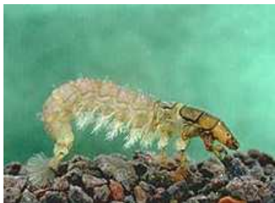
Hydropsyche - do 1 cm hnědozelený, lapací síť