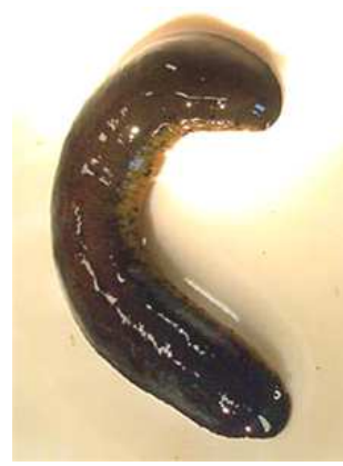
Haemopsis sanguisuga p. koňská - do 10 cm tmavá, velká