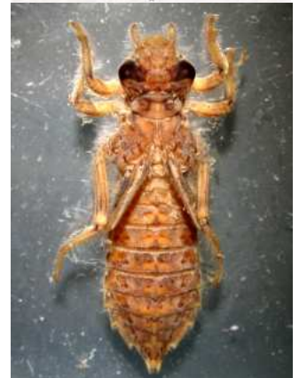
Codulegaster - páskovec