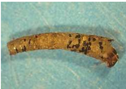
Sericostoma - do 1,5 cm jemnozrná okrouhlá schránka s otvorem