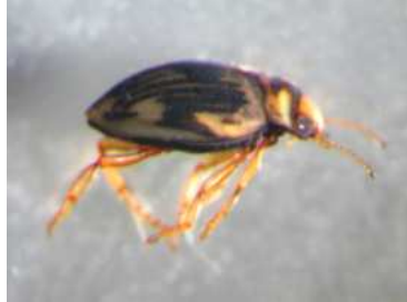
Oreodytes - dospělec 0,4 cm