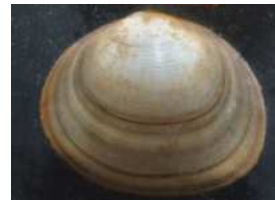
Sphaerium - okružanka 0,5 - 2,2 cm