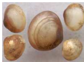
Pisidium - hrachovka do 0,5 cm