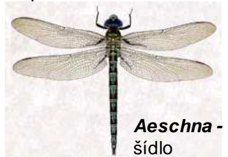
Aeschna - šídlo