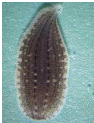
Glossiphonia complanata chobotnatka plochá do 1,5 cm plochá, světlejší