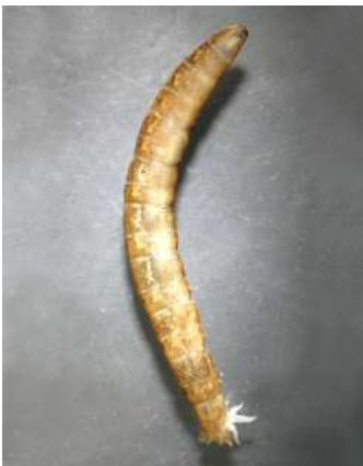
Tipula Tiplice 2-6 cm, velké tlusté larvy