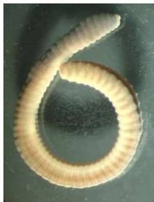
Eiseniella tetraedra 2-5 cm, silnější, větší