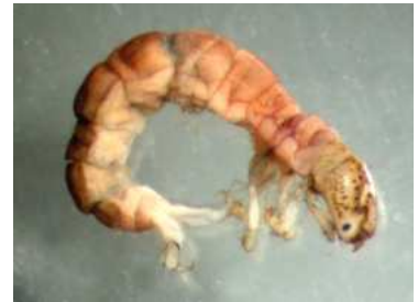
Polycentropus - do 1,2 cm růžovohnědý, dravý, pŕlměsíci na hlavě, říčky