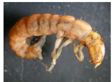
Plectrocnemia - do 1,2 cm růžovohnědý, dravý, potoky