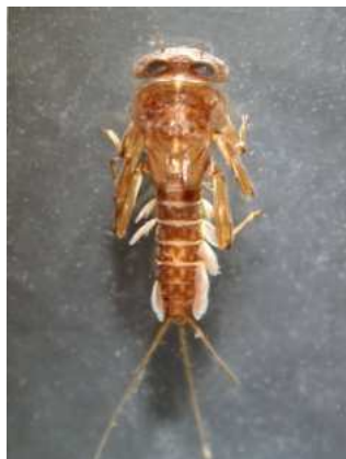
Ecdyonurus - do 1,5 cm plochá, široká „ramena“