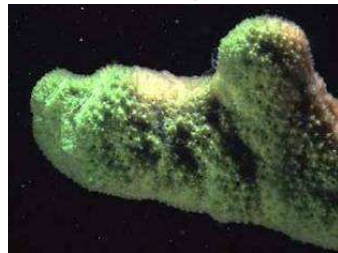
Ephydatia fluviatilis -houbovec říční