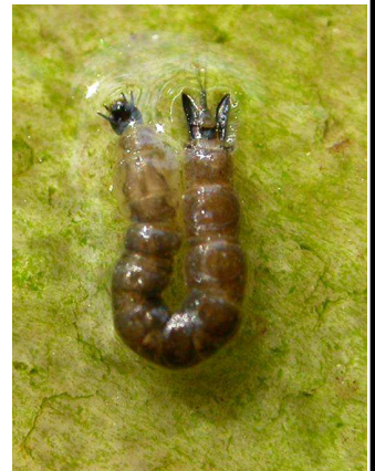
Dixa komárec – do 0,7 cm na hladině, do U stočený