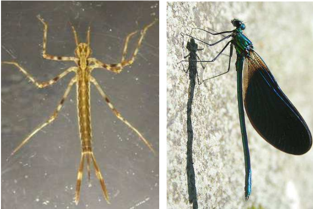
Calopteryx virgo - motýlice lesklá, 4 cm