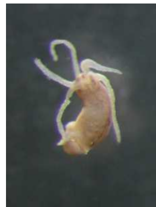
Hydra nezmar – do 0,4 cm