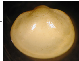
Musculium lacustre – okrouhlice rybničná 0,9 cm