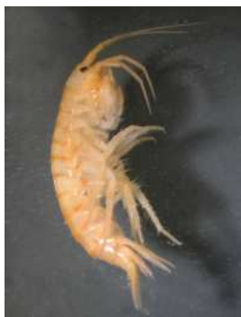
Gammarus fossarum blešivec potoční, 1,5 cm