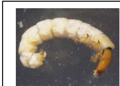
Philopotamus - do 1,2 cm žlutá hlava, dravý, potoky