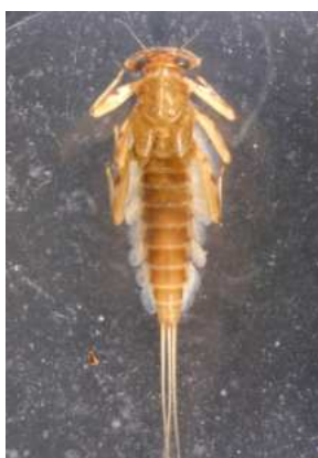
Rhitrogena - do 1,5 cm trach.žábra tvoří přísavku