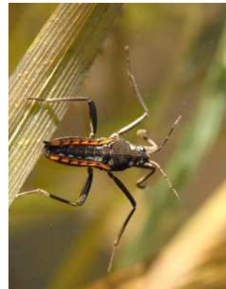
Velia - hladinatka 1 cm, potoky