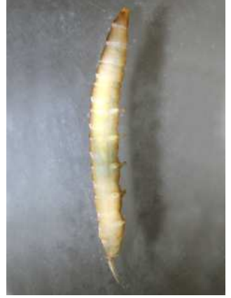
Dicranota do 1 cm 4-5 párů panožek