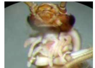
Protonemura - do 1 cm