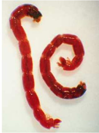
Chironomus – do 1,8 cm velký, červený