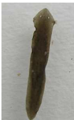
Dugesia gonocephala ploštěnka potoční 1,5 cm