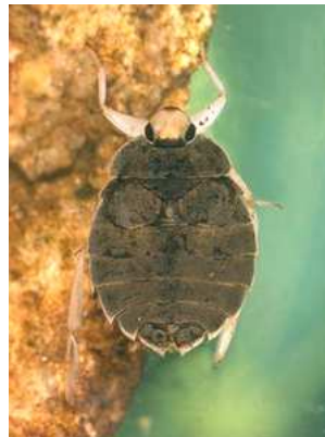
Aphelocheirus aestivalis hluběnka skrytá, do 1,5 cm