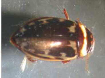
Platambus - dospělec 0,9 cm