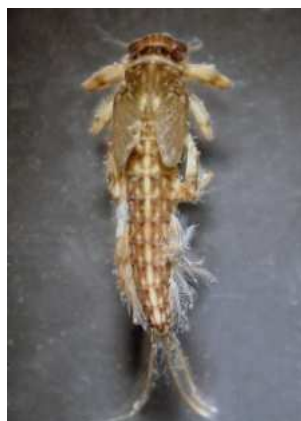
Potamanthus - do 1,3 cm