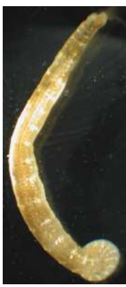
Piscicola geometra chob. rybí - do 4 cm tenká, pruhovaná