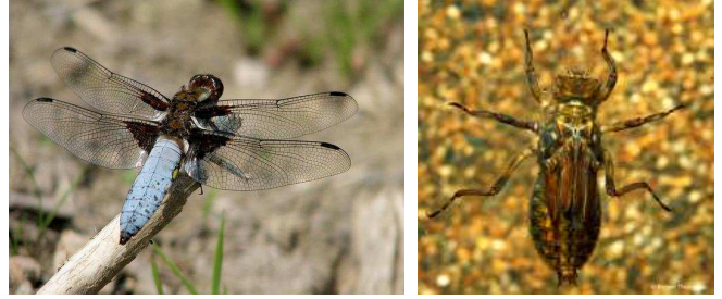
Libellula depressa - vážka plošká, do 4 cm, bez list.přívěsků