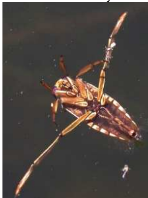
Notonecta – znakoplavka plave naznak, do 1,7 cm