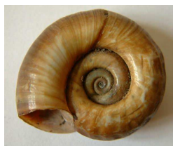
Planorbis corneus – okružák plošný do 3 cm