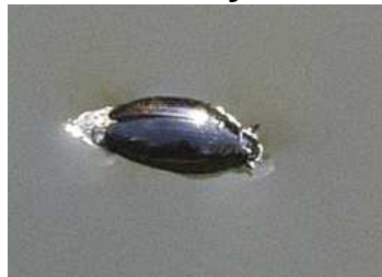
Oretochilus villosus - vírník huňatý