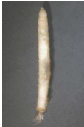
Eloeophila bahnomilka 1-3 cm, bez panožek