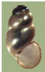
Bythinella austriaca – praménka rakouská – do 0,3 cm