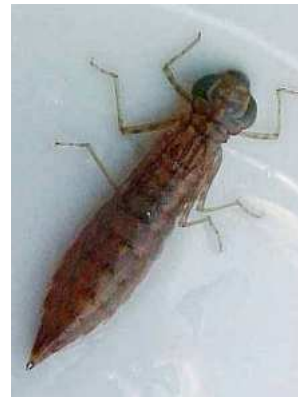
Aeschna - šídlo