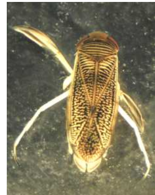
Corixa, Sigara , - klešťanka 0,5-1,3 cm