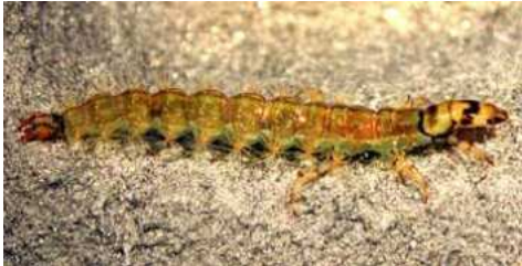
Rhyacophila - do 1 cm zelený, dravý