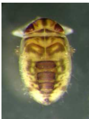
Micronecta – klešťanečka, 0,4 cm, drobná, rychlý pohyb