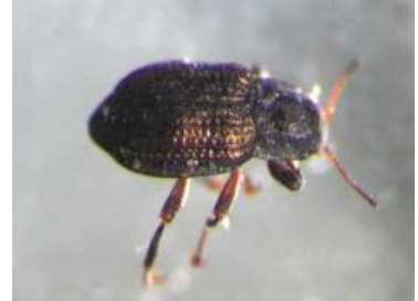
Elmis - vodnář, dospělec 0,3 cm