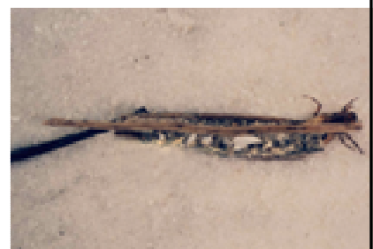
Anabolia - do 1,3 cm s dlouhými podél. dřívky