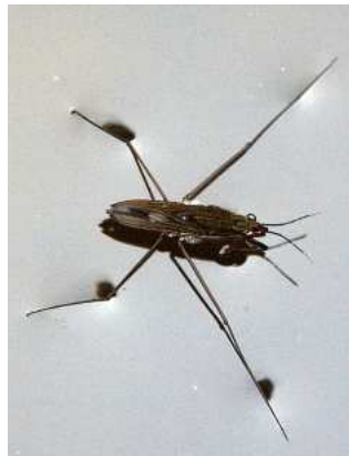
Gerris - bruslařka 1-2 cm, na otevřené hladině