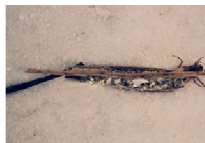
Anabolia - do 1,3 cm s dlouhými podél. dřívky