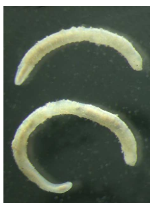
Nais - do 1cm drobné, tenké, s očima