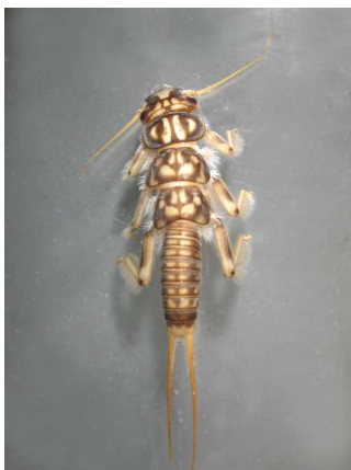
Perla - 1,5 -3 cm s keříčky žaber