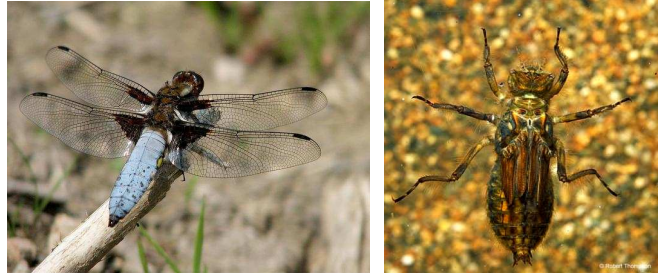
Libellula depressa - vážka ploská, do 4 cm, bez list.přívěsků