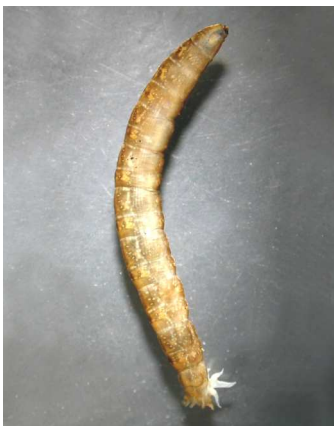
Tipula Tiplice 2-6cm, velké tlusté larvy