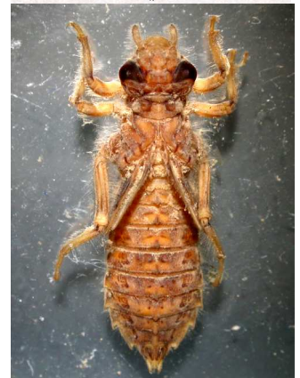
Cordulegaster - páskovec