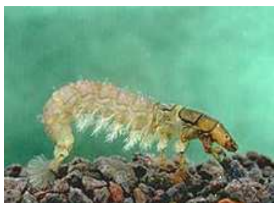
Hydropsyche - do 1cm hnědozelený, lapací síť