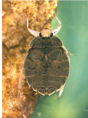
Aphelocheirus aestivalis hlubenka skrytá, do 1,5 cm