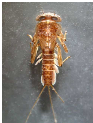
Ecdyonurus - do 1,5cm plochá