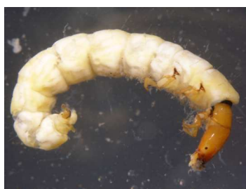
Philopotamus - do 1,2cm žlutá hlava, dravý, potoky