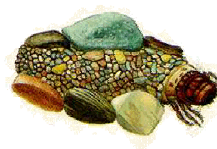
Silo - do 1 cm boční kaménky schránky