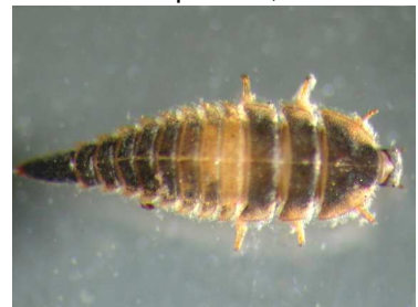
Elmis - larva 0,4cm