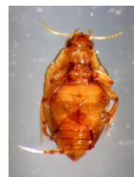
Halipus - do 0,3 cm