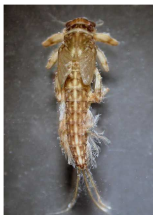
Potamanthus - do 1,3cm