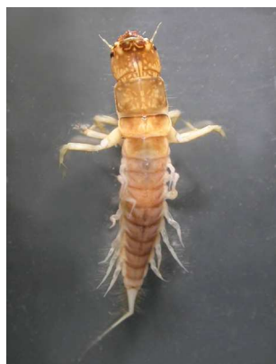
Sialis střechatka -1 štět do 2 cm, dravá