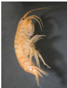
Gammarus fossarum blešivec potoční, 1,3cm