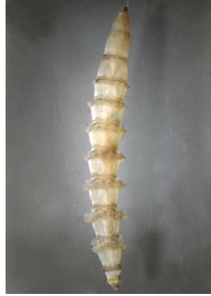
Tabanus ovád – 1-2 cm kresba, 6-8 panožek na čl.