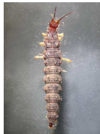
Osmylus fulvicephalus strumičník do 1,5 cm, u břehů