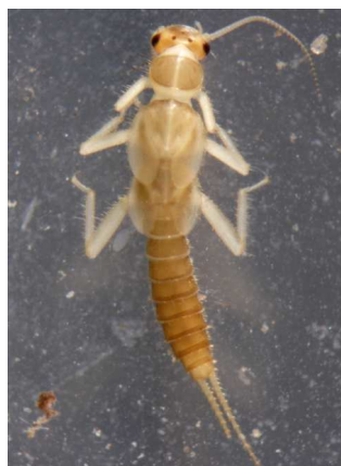
Siphonoperla - do 1,2 cm kruhové křídelní pochvy