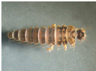
Elodes - mokřadník, larva 1cm