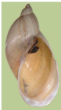
Radix (Lymnaea) – plovatka, do 1,7 cm nemá víčko v ústí