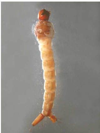
Culex - komár – do 1cm zadečkem u hladiny