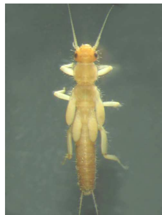
Leuctra - 1 cm světlá, štíhlá