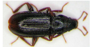
Hydraena - vodník, do 0,3 cm