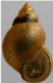
Bithynia tentaculata – bahnivka rmutná do 1,7 cm má víčko v ústí