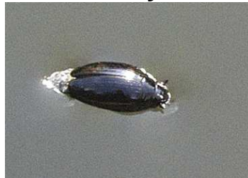
Orectochilus villosus - vírník huňatý