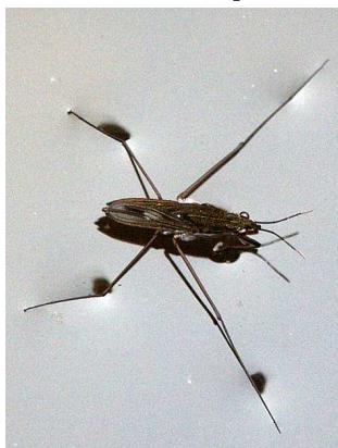
Gerris - bruslařka 1-2cm, na otevřené hladině