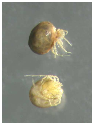
(vodní roztoči) 0,2cm