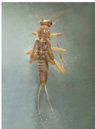
Nemoura - 1 cm tmavá, zavalitá