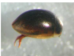
Anacaena - do 0,3 cm