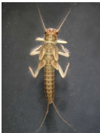
Isoperla - do 1,5 cm