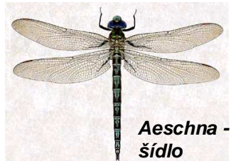
Aeschna - šídlo