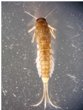
Baetis rhodani - do 1 cm rybičkovitá