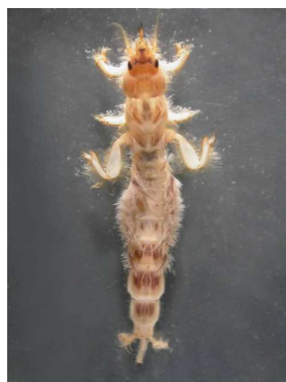
Ephemera danica do 2 cm, hrabavá larva