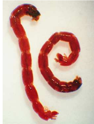
Chironomus – do 1,8cm velký, červený