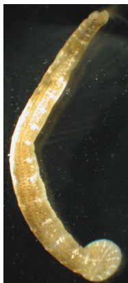
Piscicola geometra chob. rybí - do 4 cm tenká, pruhovaná