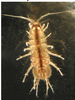
Asellus aquaticus beruška vodní do 1,3cm