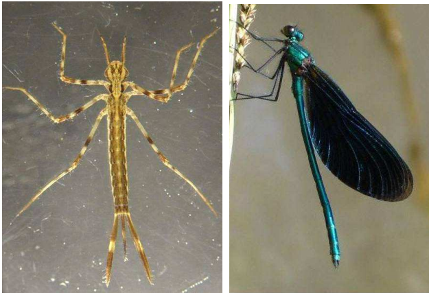
Calopteryx virgo motýlice obecná, 4cm