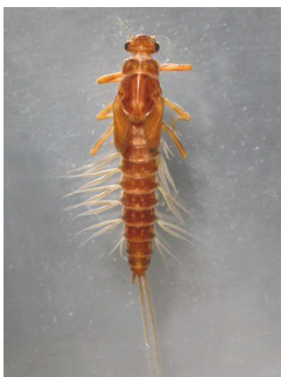
Paraleptophlebia do 1cm, větvená žábra