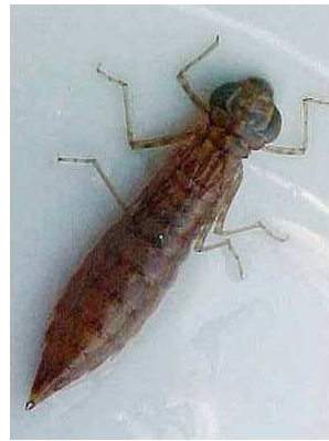
Aeshna - šídlo