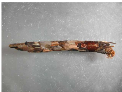
Chaetopteryx - do 1,5 cm z lístků i písku