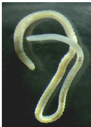
Tubifex tubifex 1-3 cm červené, bílé.