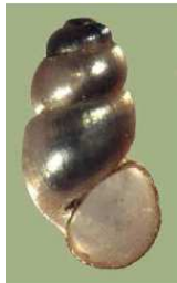
Bythinella austriaca – praménka rakouská – do 0,3 cm