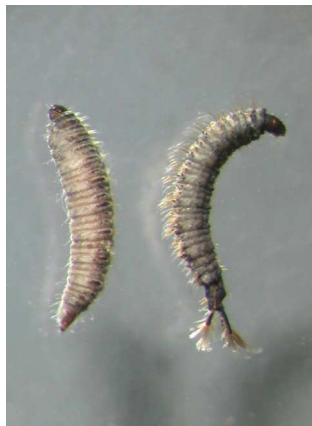
Pericoma koutule – do 1cm tmavé