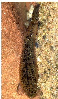
Erpobdella octoculata hltnanovka - do 3 cm nejhojnější, tmavá