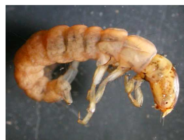
Plectrocnemia - do 1,2cm růžovohnědý, dravý, potoky