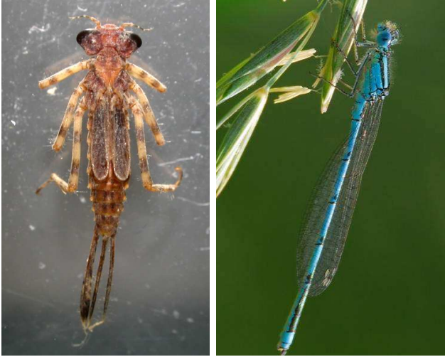
Platycnemis pennipes šidélko brvonohé, 3 cm