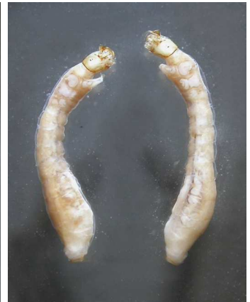
Simulium - muchnička 1 cm přisedlá zadečkem