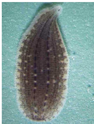
Glossiphonia complanata chobotnatka plochá do 1,5cm plochá, světlejší