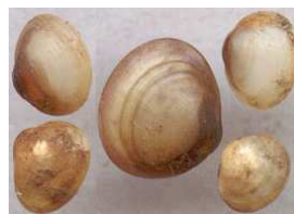
Pisidium - hrachovka do 0,5 cm