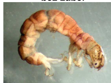
Polycentropus - do 1,2cm růžovohnědý, dravý, pŕlměsíe na hlavě, říčky