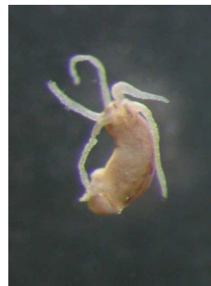
Hydra nezmar – do 0,4 cm