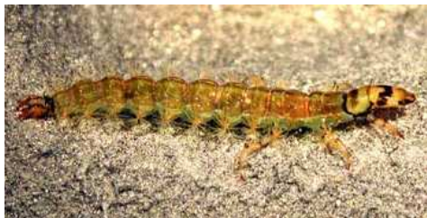
Rhyacophila - do 1cm zelený, dravý