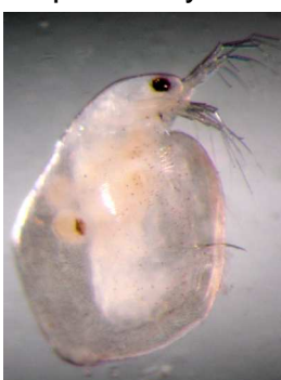
Cladocera – do 0,3 cm