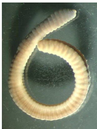
Eiseniella tetraedra 2- 5cm, silnější, větší