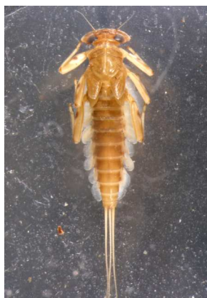
Rhitrogena - do 1,5cm trach.žábra tvoří přísavku