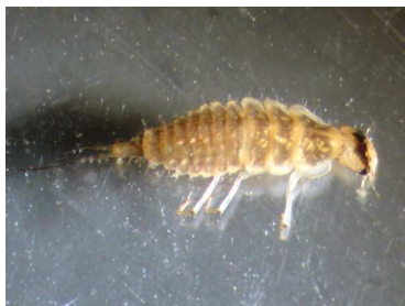
Platambus - larva 0,7cm