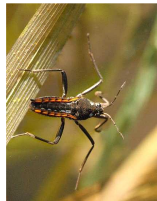
Velia - hladinatka 1-2cm, potoky