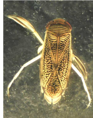
Corixa, Sigara , - klešťanka 0,5-1,3cm