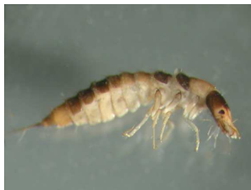
Oreodytes - larva 0,5cm