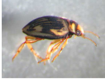
Oreodytes - dospělec 0,7cm