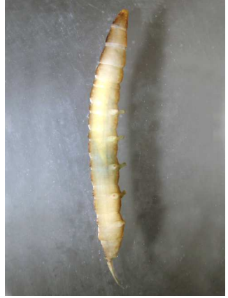
Dicranota do 1cm 4-5 párů panožek