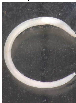
Enchytraeidae do 1 cm, bílá tuhá tělo