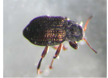
Elmis - vodnář, dospělec 0,2cm