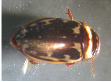
Platambus - dospělec 1cm