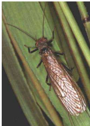
Perla - imago