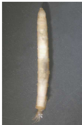
Eloeoiphila bahnomilka 1-3cm, bez panožek