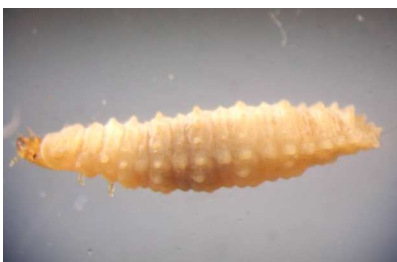
Hydrophilidae - larva do 1 cm