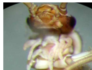
Protonemura - do 1 cm