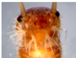
Amphinemura - do 0,8 cm