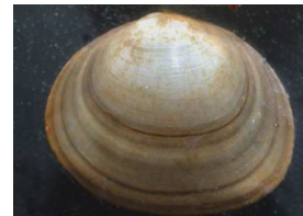
Sphaerium - okružanka 0,5 - 2,2 cm