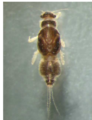
Caenis - do 0,8 cm