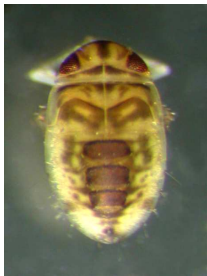
Micronecta – klešťanečka, Notonecta – znakoplavka 0,3 cm, drobná, rychlý pohyb plave naznak, do 1,7 cm