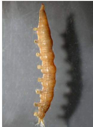
Atherix ibis – číhalka pospolitá, dravá, tekoucí v.