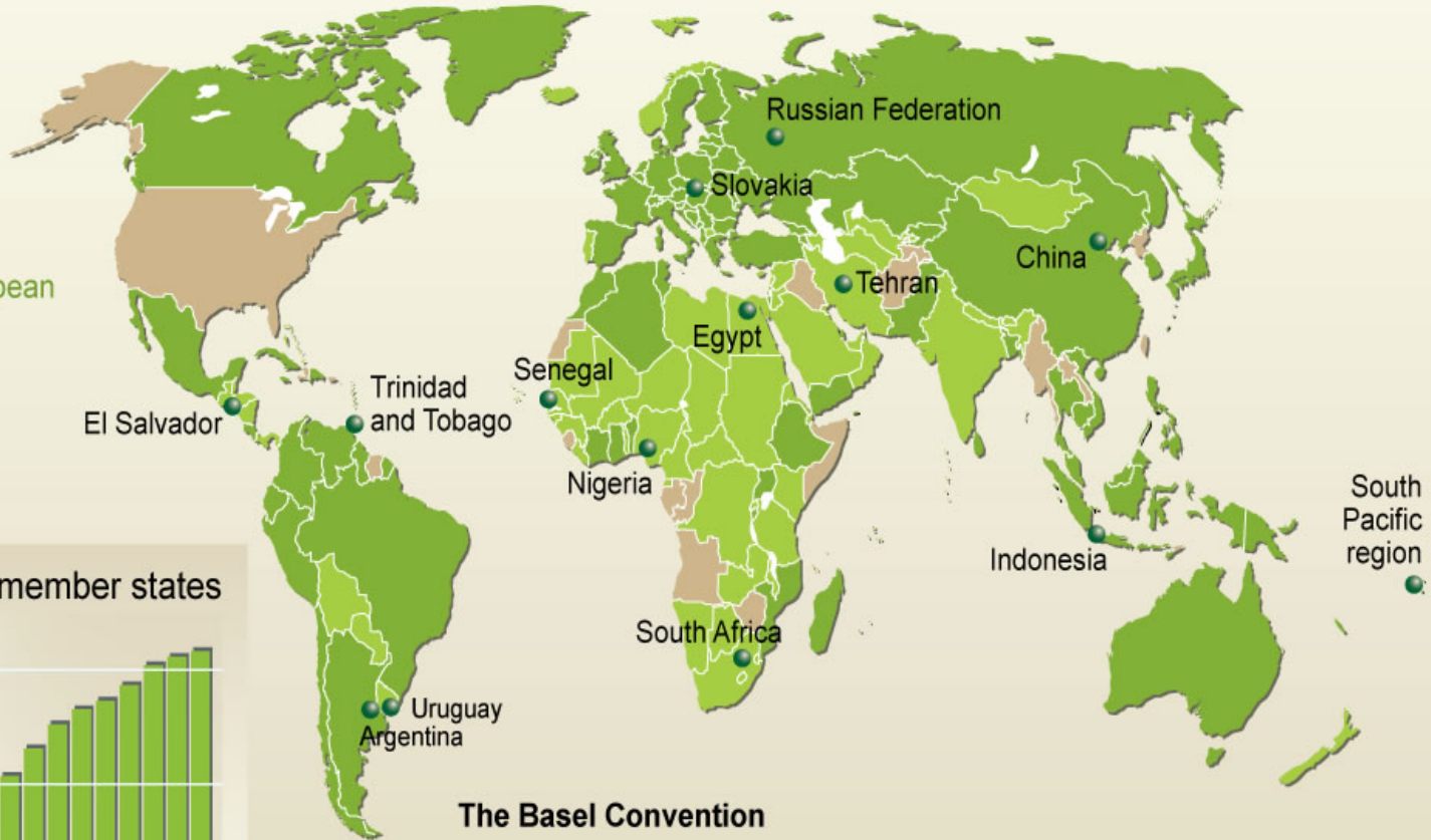
Number of member states