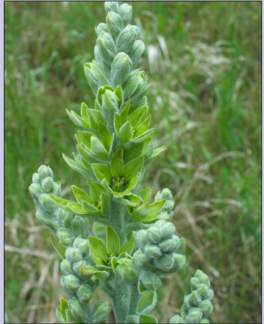
Veratrum album subsp. lobelianum