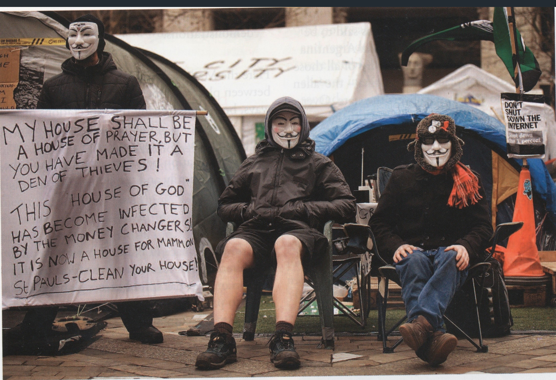
Figure 17.5 Occupy London protesters camped outside St Paul's Cathedral, London.