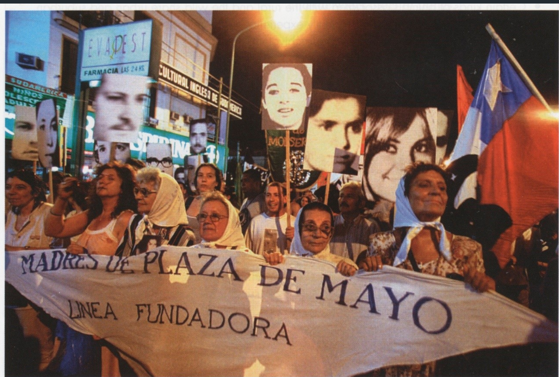
Figure 17.4 Protest by the Plaza de Mayo Madres (the Mothers of the Disappeared) in Buenos Aires, 1985. More than 10,000 attended.