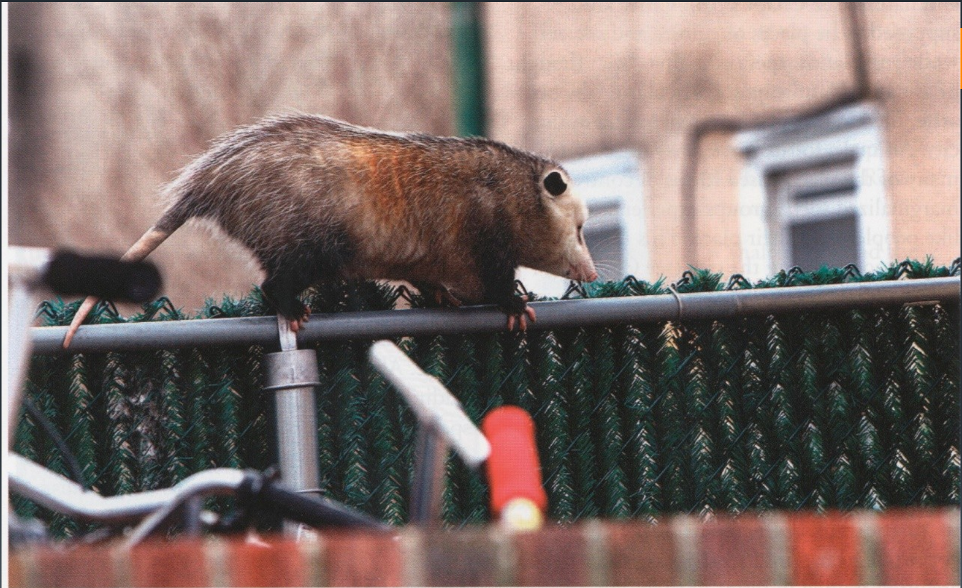
advertisement for Novis breed. Credit: the Figure 17.3 An urban possum. Credit: Getty Images