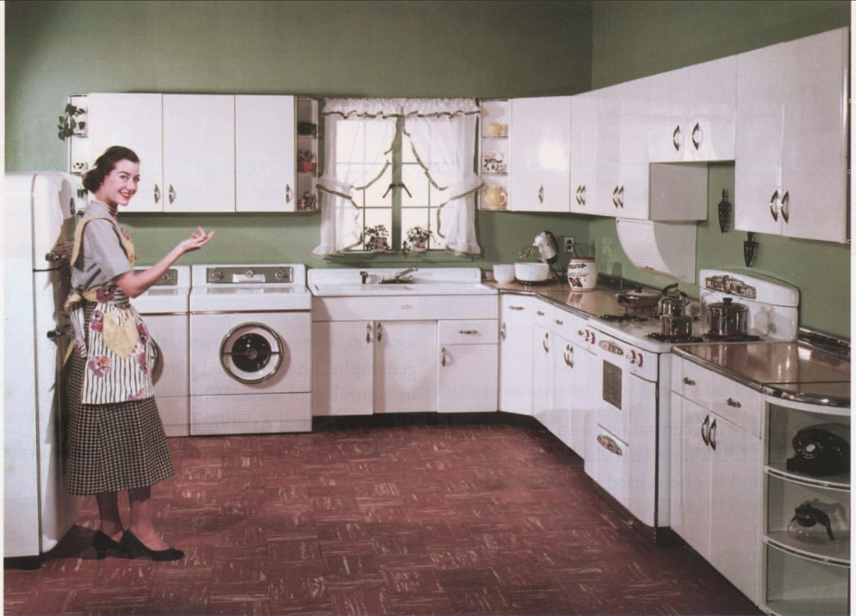
Figure 17.1 A woman's place is in the home? A stereotypical image of a post-war US housewife.