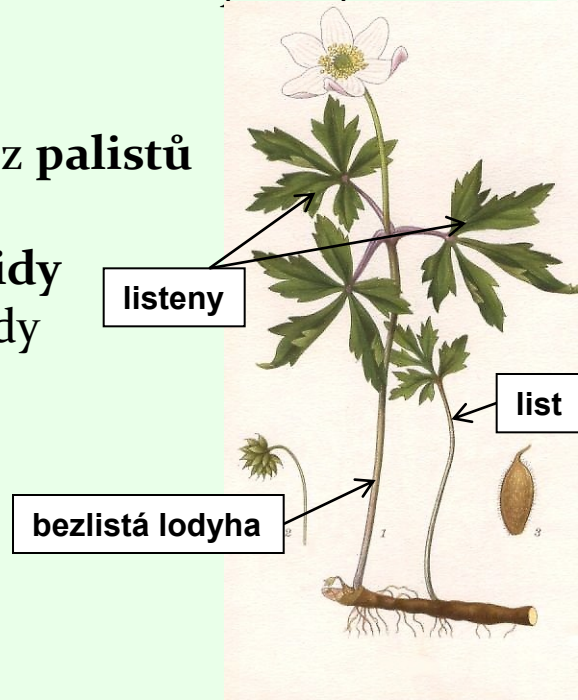
Anemone nemorosa (sasanka hajní)