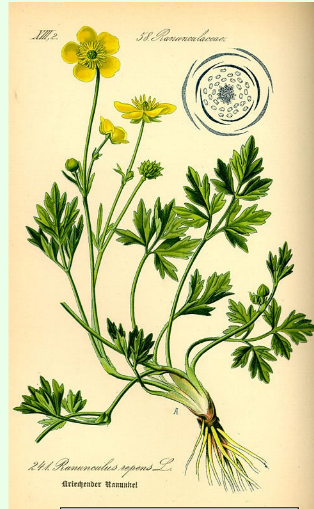
Ranunculus repens (pryskyřník plazivý)