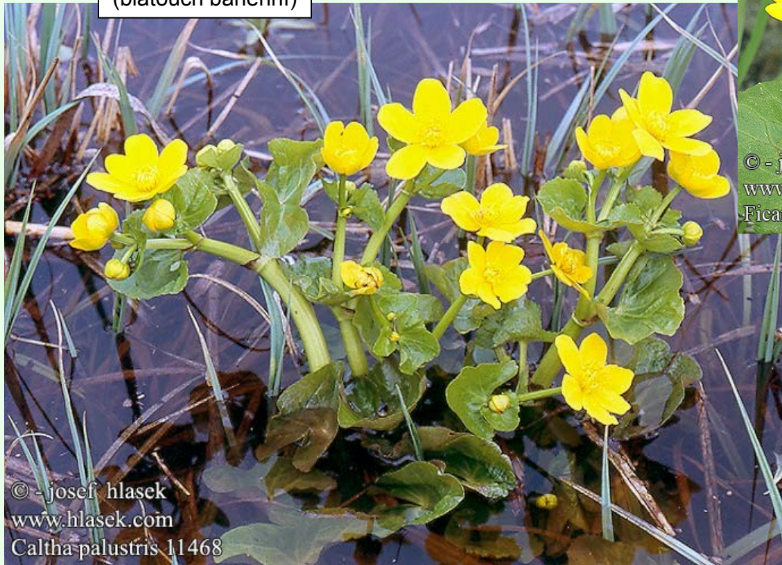
Caltha palustris (blatouch bahenní)