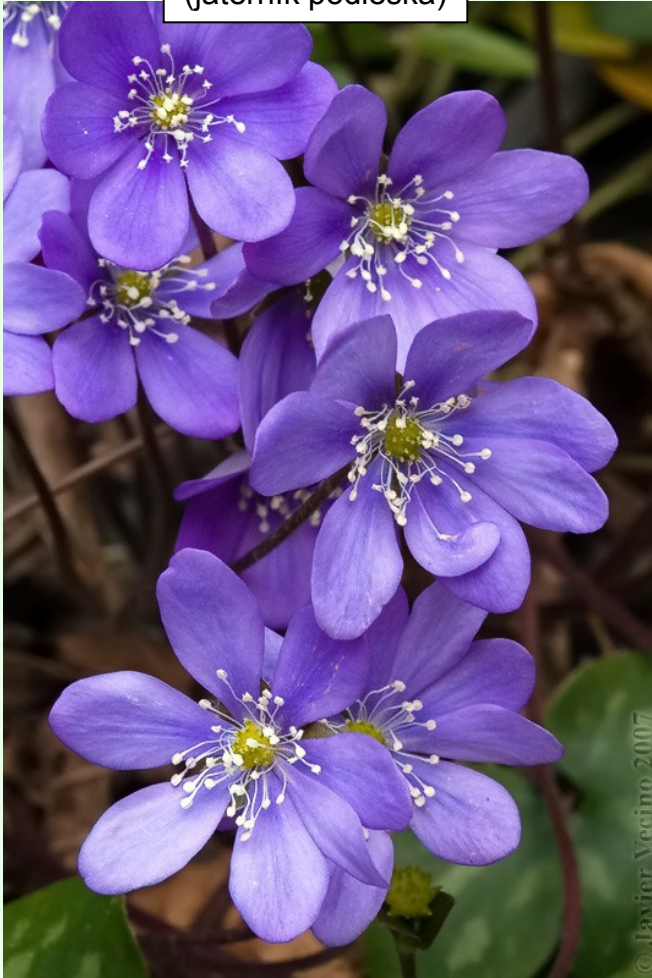
Hepatica nobilis (jaterník podléška)