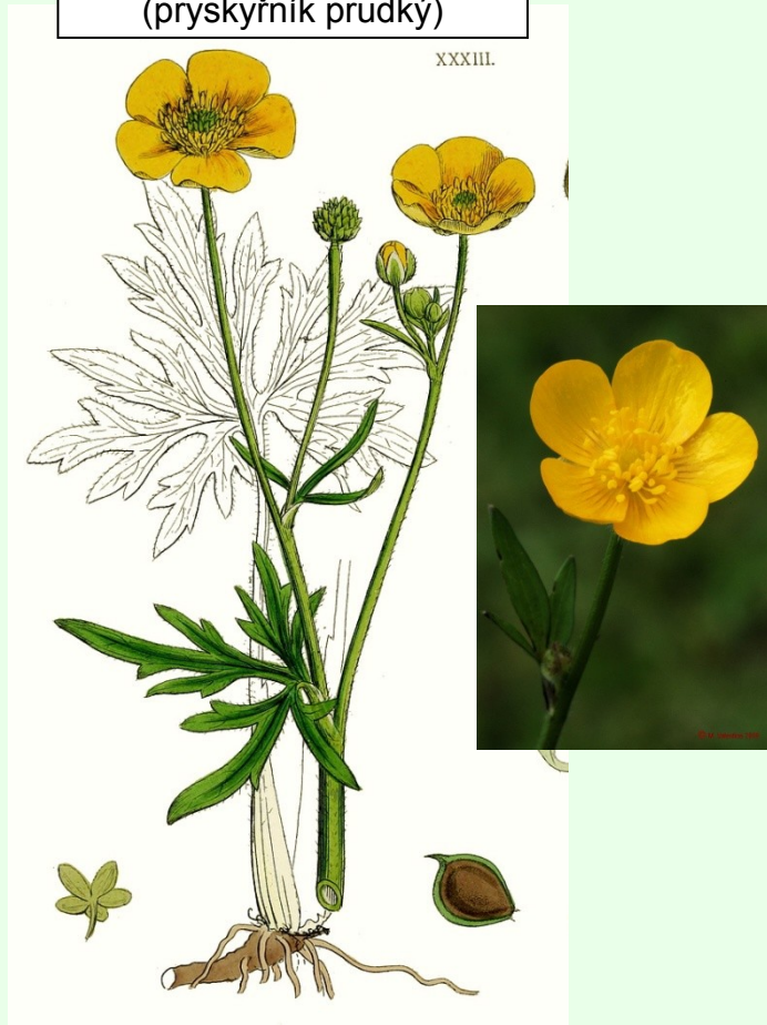
Ranunculus acris (pryskyřník prudký)