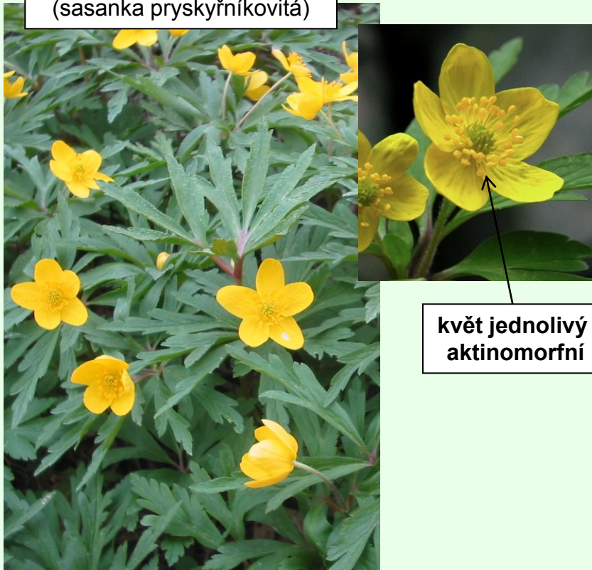
květ jedolivý aktinomorfní