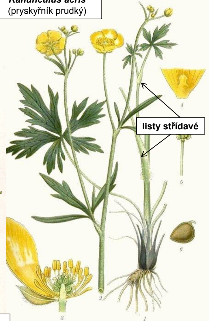
Ranunculus acris (pryskyřník prudký)