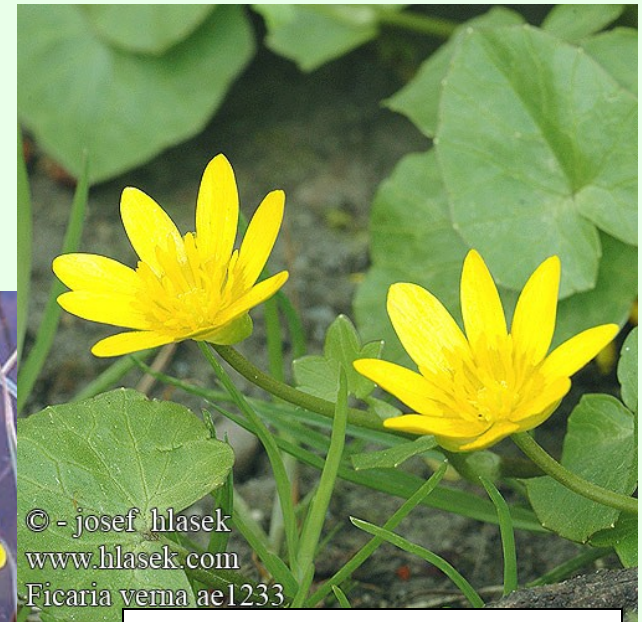
Ficaria verna subsp. bulbifera (orsej jarní)