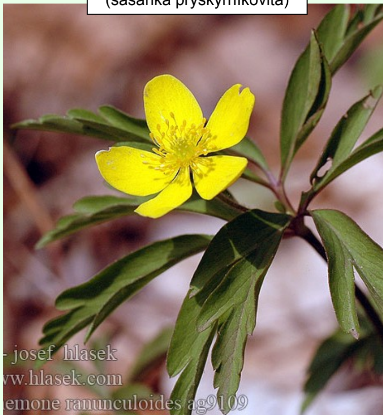
Anemone ranunculoides (sasanka pryskyřníkovitá)