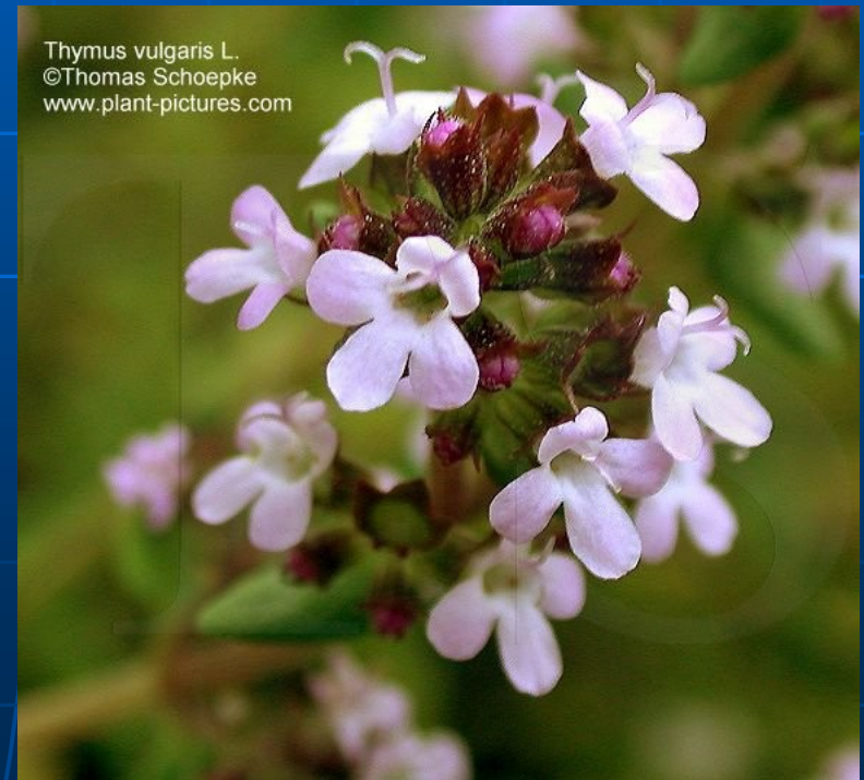
Thymus vulgaris L.