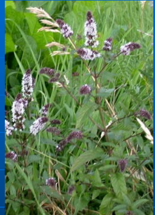
Mentha × piperita