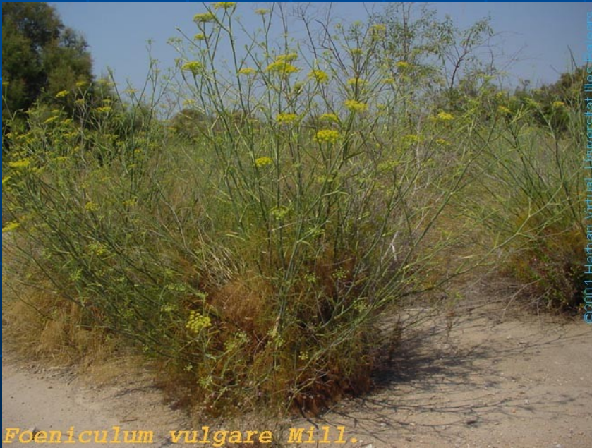
Foeniculum vulgare Mill.