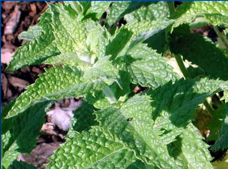
Mentha × crispa