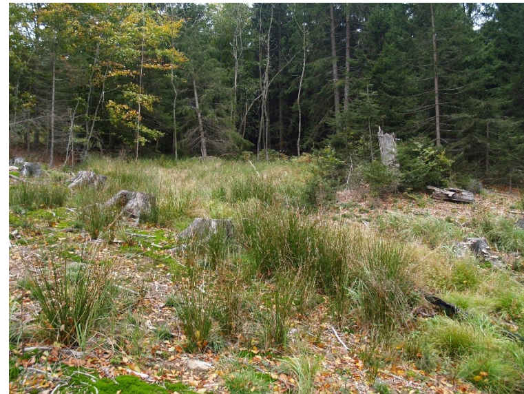
Strukturní plošina s prameništěm vně hradiska – nalezen depot