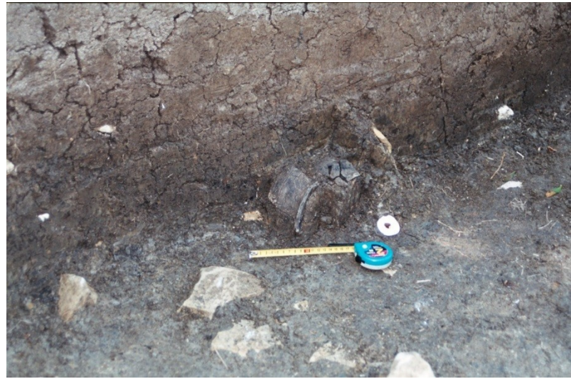
Velkomoravské hradisko Pohansko – profil hradištního valu