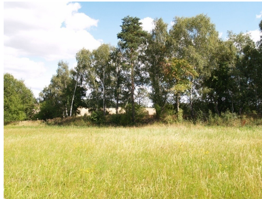
Příklad slovanského hradiska Mařín v oblasti jižně Moravské Třebové