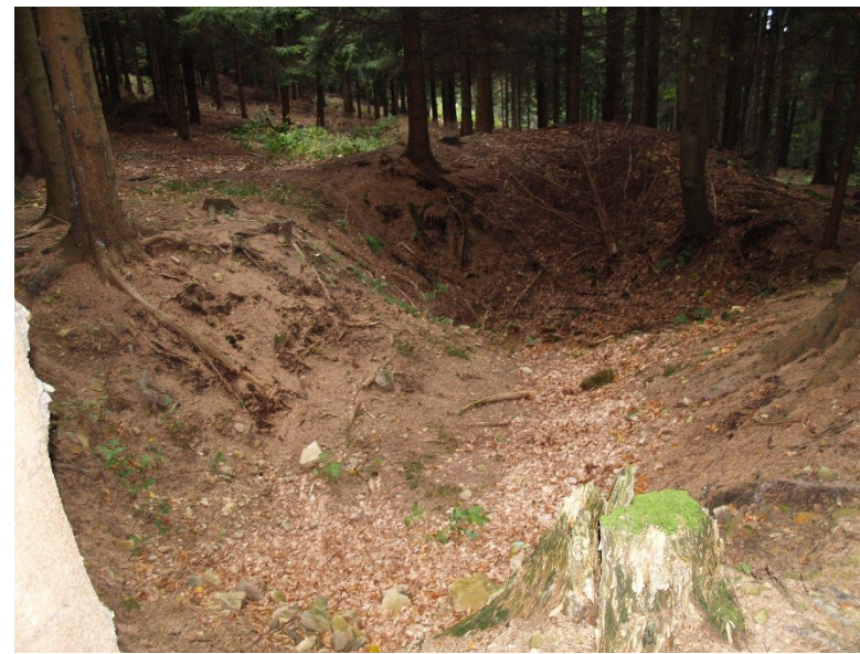
Sníženina na hradisku využitá jako studna