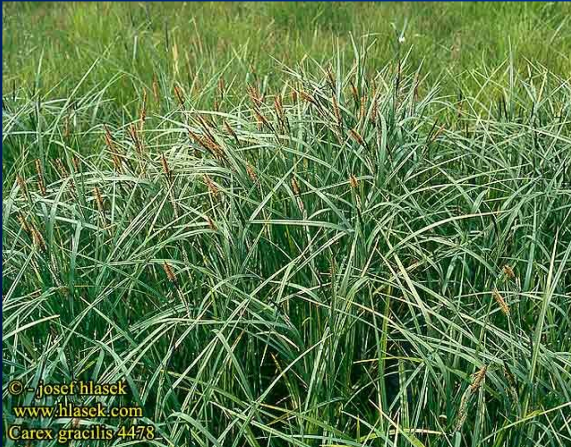
Ostřice štíhlá – Carex gracilis

• Euochtofyta – optimum lit.–lim., ter. – dl., méně biomasy, vysoké ostřice; ostřice pobřežní – Carex riparia , ostřice měchýřkatá – Carex vesicaria , ostřice vyvýšená – Carex elata ; fyto. – Magno-Caricion gracilis , Magno-Caricion elatae