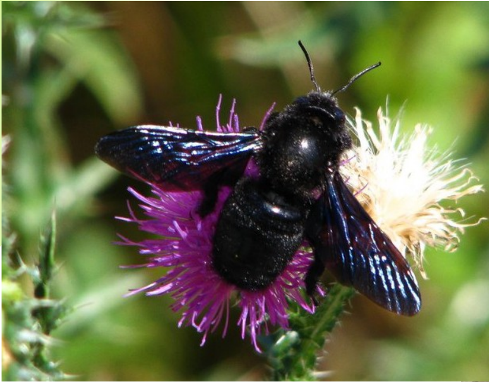
Drvodělka fialová ( Xylocopa violacea )