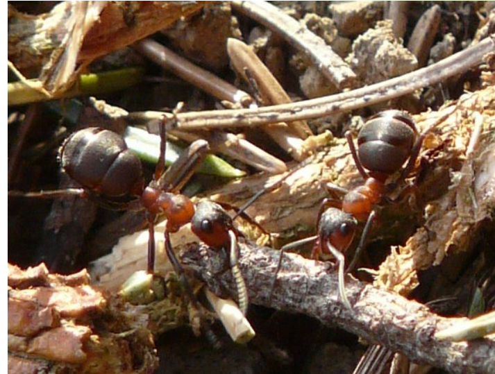
Formica sp. (Formicidae)