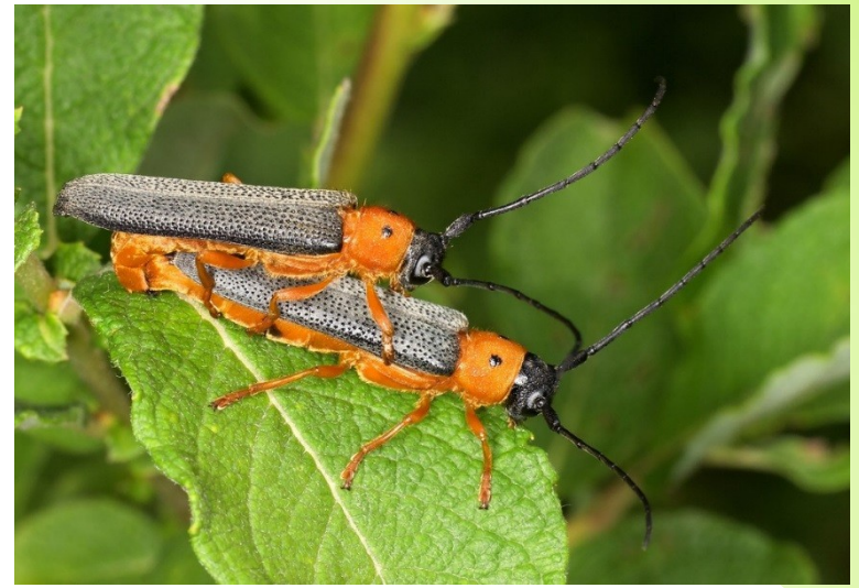
Kozlíček dvojtečný (Cerambycidae) - vrby