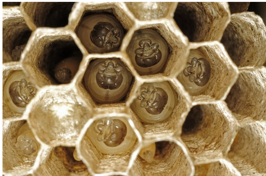
Vosík francouzský podčel. Polistinae