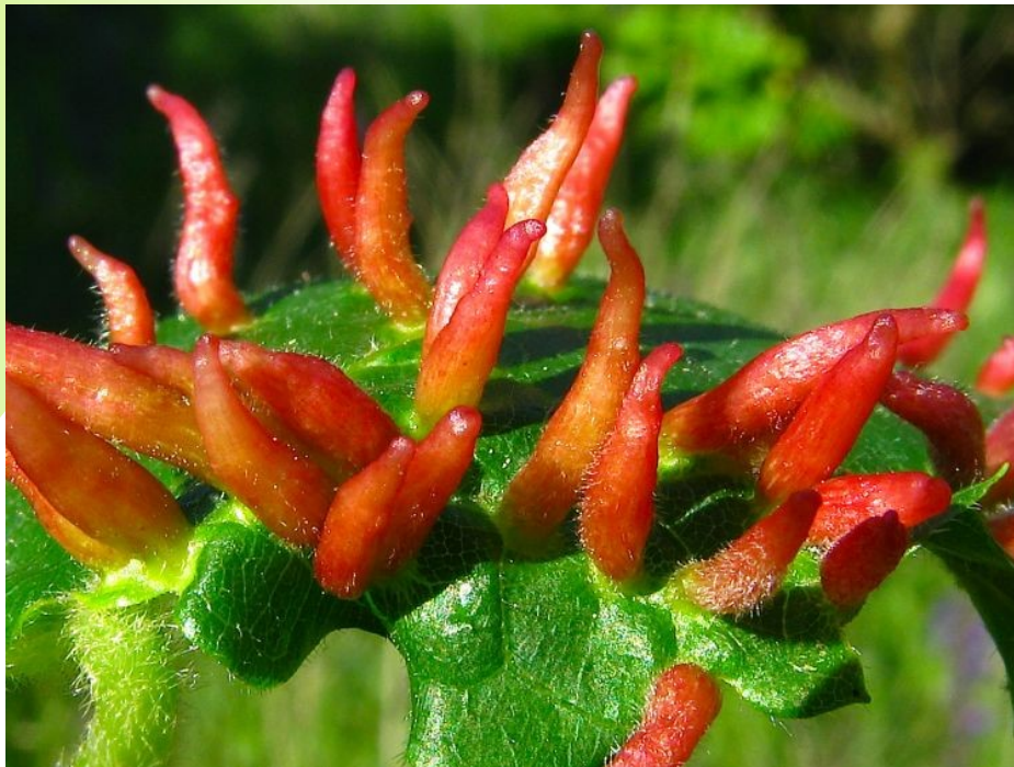
Vlnovník lipový ( Eriophyes tiliae )