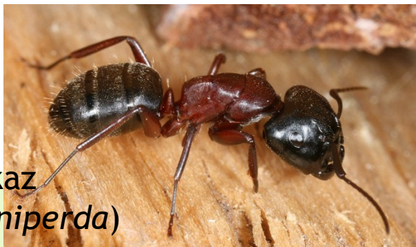
Mravenec dřevokaz ( Camponotus ligniperda )