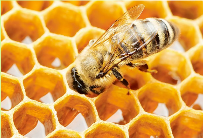
Včela medonosná ( Apis mellifera )