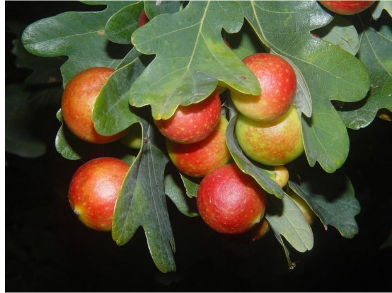
Žlabatka dubová ( Cynips quercusfolii )