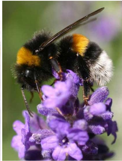
Čmelák zemní ( Bombus terrestris )