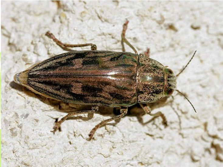
Krasec měďák (Coleoptera: Buprestidae) - borovice