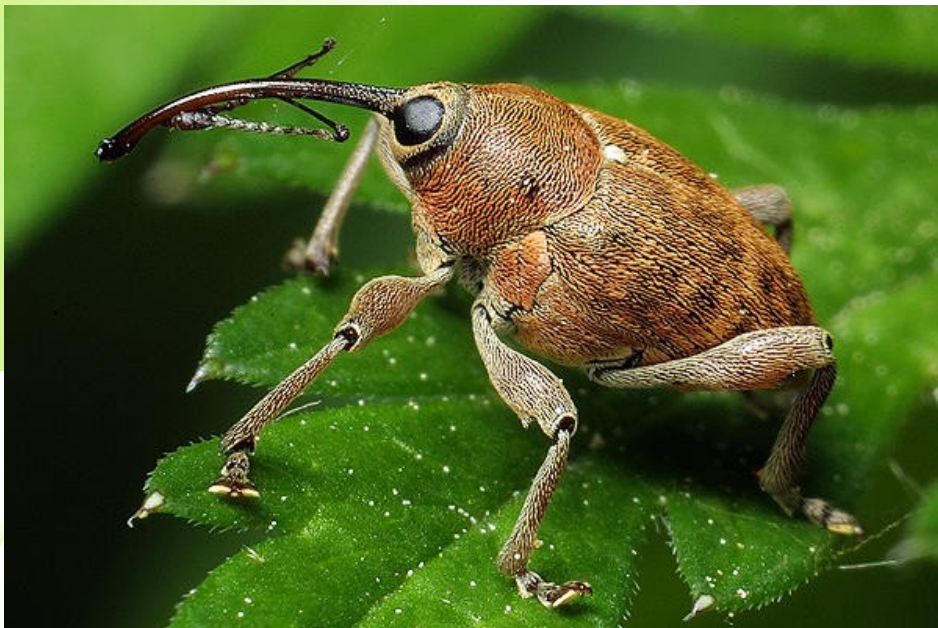
Nosatec lískový ( Curculio nucum ) - Coleoptera: Curculionidae