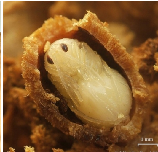
Žlabatka duběnková ( Andricus kollari )