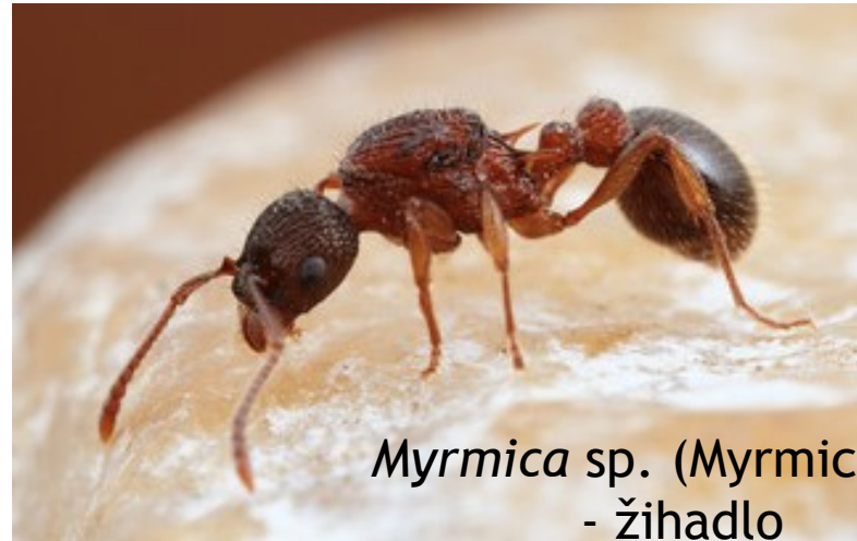
Myrmica sp. (Myrmicinae)