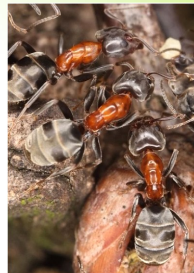
Mravenec lužní ( Liometopum microcephalum )