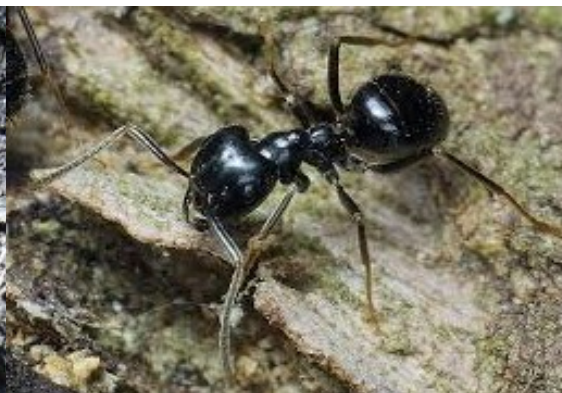
Mravenec černošklý ( Lasius fuliginosus )