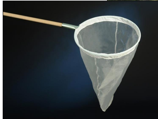
ruční síť na rámu = „bentoska”