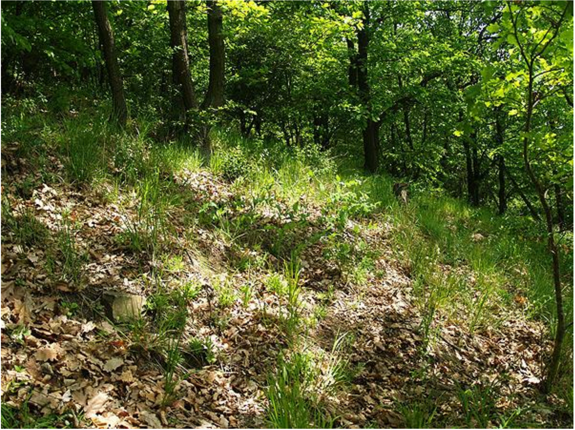
Obr. 4 L6.5 Acidofilní teplomilné doubravy