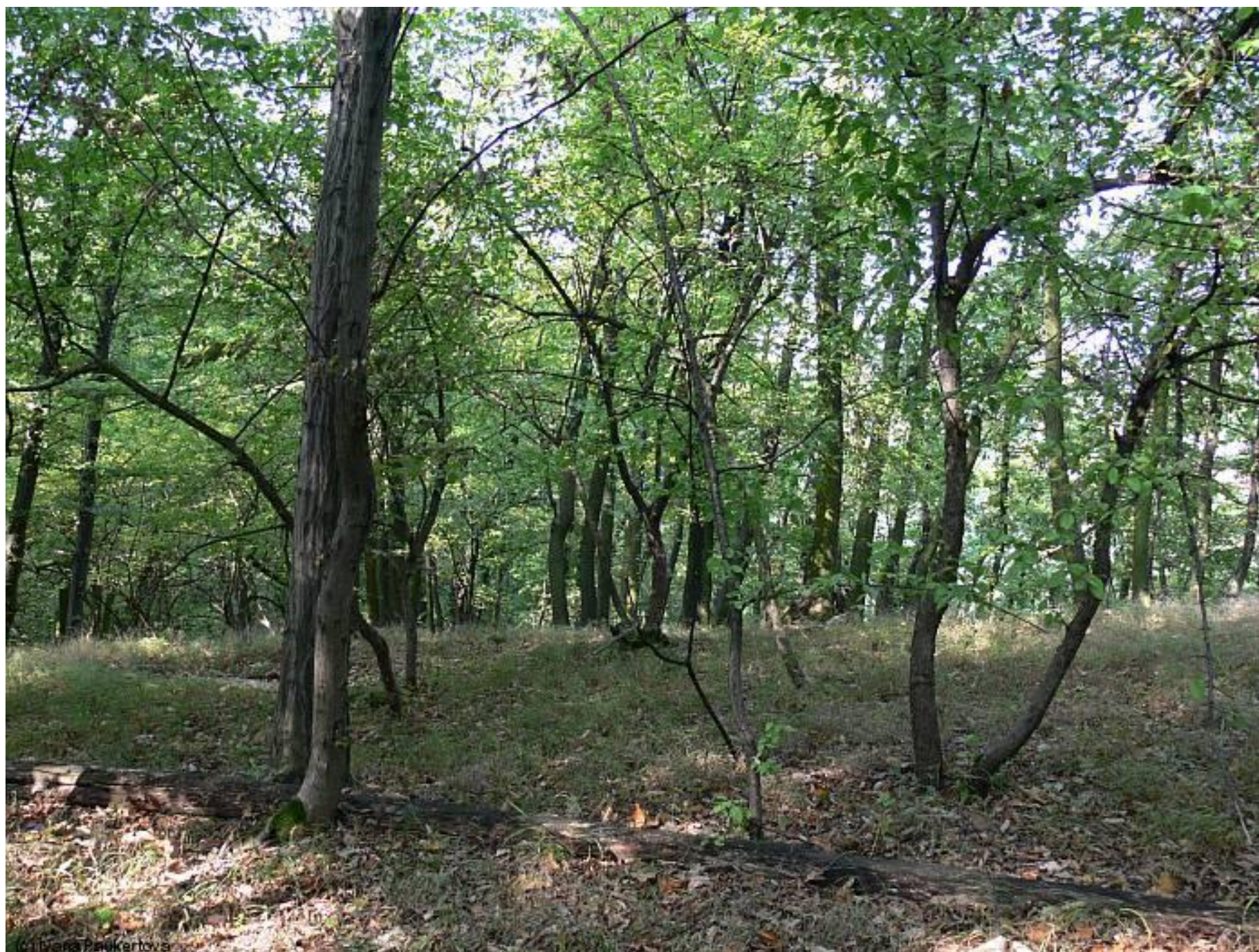
Obr. 3 L6.5 Acidofilní teplomilné doubravy