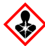
GHS08 – látky nebezpečné pro zdraví