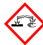
GHS05 - korozivní a žíravé látky