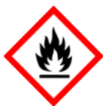
GHS02 - hořlavé látky

Výstražné symboly nebezpečnosti – označování nebezpečných chemických látek a směsí, např.: