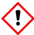
GHS07 - dráždivé látky