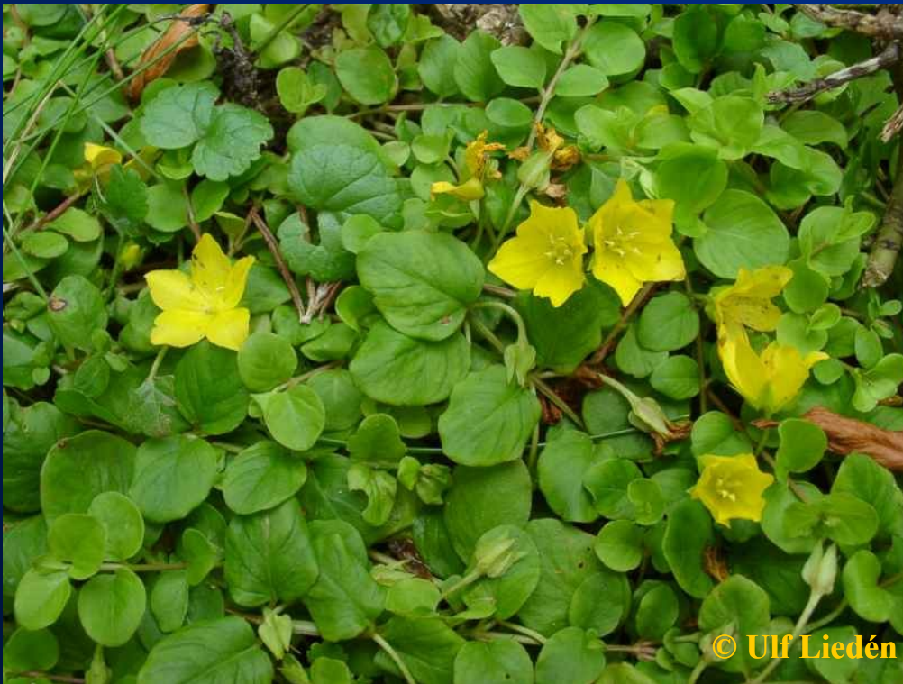
Vrbina penížková – Lysimachia nummularia

• Trichohydrofyta – ter., tolerance k zaplavení (za nízkých teplot i několik měsíců); periodicky zaplav. břehy vod; vrbina penížková – Lysimachia nummularia , mochna husí – Potentilla anserina , pryskyřník plazivý – Ranunculus repens ; fytoc. – Molinio-Arrhenatheretea