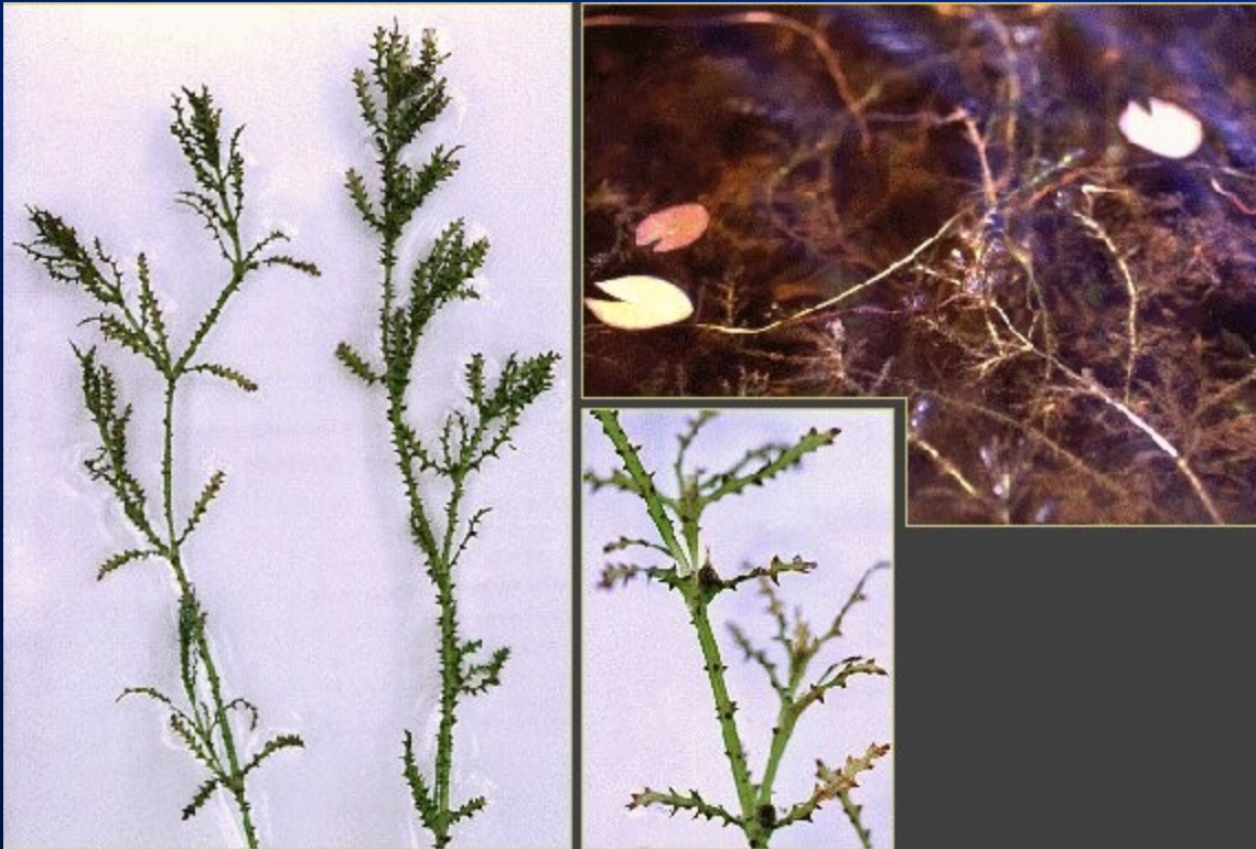
Řečanka přímořská – Najas marina