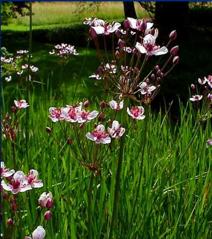
Šmel okoličnatý – Butomus umbellatus

• Hydroochtofyta – (hydr.) lit.–lim. (ter.), vyžadují periodické kolísání vody; šmel okoličnatý – Butomus umbellatus ), rukev obojživelná – Rorippa amphibia , žabník – Alisma spp., tajnička rýžovitá – Leersia oryzoides ; fytoc. Phragmito-Magnocaricetea ( Eleocharito-Sagittarion , Glycerio-Sparganion )