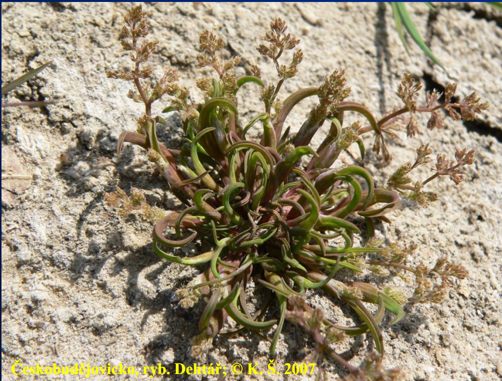
Puchýřka útlá – Coleanthus subtilis

• Pelochtofyta – lim.–ter., hydr. v semenech; obnažené substráty, jednoletky; sítina žabí – Juncus bufonius , ostřice česká – Carex bohemica , puchýřka útlá – Coleanthus subtilis , rukev bahenní – Rorippa palustris ; fytoc. – Isoëto-Nanojuncetea , Bidentetea